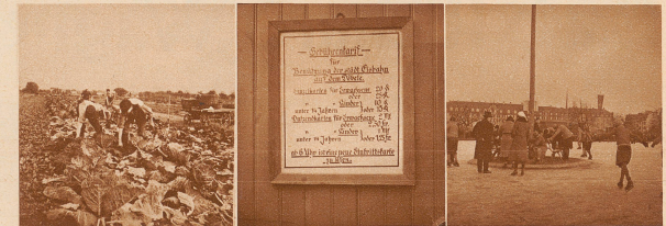
Das Tägermoos ist ein sehr fruchtbares Stück Land. Große Gemüsegärten dehnen sich in breiten Streifen über das Feld

Das Gebäude in der Mitte im Hintergrund ist das sogenannte Trompeterschlößli. Die Post von und zu diesem Hause mußte lange Zeit den Umweg über Kreuzlingen-Tägerwilen machen, weil das so nahe bei Konstanz befindliche Gebäude auf Tägerwiler-Boden steht. Da nun die Post von Tägerwilen aus täglich nur einmal vertragen wird, erhielt der Schlößliwirt die Konstanzer Zeitungen jeweils um einen Tag zu spät. Nun hat er bei der Behörde die Erlaubnis eingeholt, am Grenzbach, auf deutschem Boden, einen Briefkasten anbringen zu dürfen, so daß er wenigstens die deutsche Post direkt von Konstanz her erhält