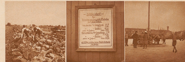
Das Tägermoos ist ein sehr fruchtbares Stück Land. Große Gemüsegärten dehnen sich in breiten Streifen über das Feld