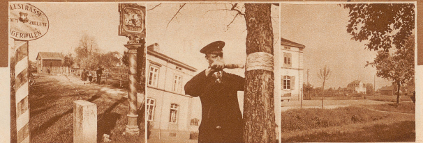
Die Grenzbachstraße, die vom Zollamt Tägerwilen nach Konstanz führt, liegt zum Teil auf schweizerischem, zum Teil auf deutschem Boden. Die weiß punktierte Linie zeigt, wie das Straßchen von der Grenze überschritten wird