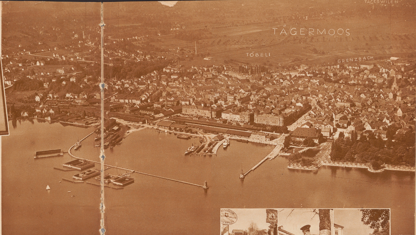
Blick vom Flugzeug auf Konstanz, Kreuzlingen, Töbeli und Tägermoos. Ganz im Hintergrund die thurgauische Gemeinde Tägerwilen. Das Töbeli gehört zur Gemeinde

Das Tägermoos ist nicht ganz ohne landschaftliche Reize. Einen guten Einblick in diesen Wesen verschafft man sich auf der Landstraße, die von Tägerwilen-Bahnhof nach Konstanz führt und die als Zufahrtsstraße zur Meersburger Fähre steigende Bedeutung gewinnt. Ungesüchtterweise geraten in Tägerwilen auf diese Straße auch viele Automobilisten, die gar nicht nach Konstanz fahren wollen und dann am Täger-