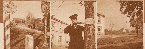
Die Grenzbachstraße, die vom Zollamt Tägerwilen nach Konstanz führt, liegt zum Teil auf schweizerischem, zum Teil auf deutschem Boden. Die weiß punktierte Linie zeigt, wie das Straßchen von der Grenze überschritten wird

An das Tägermoos stößt das «Töbeli», das zur Gemeinde Kreuzlingen gehört. Hier unterhält die Stadt Konstanz eine Eisbahn. Der Eintritt in diese wird gegen Erlegung einer Gebühr in Pfennigwährung auch Schweizern gestattet. — An alle diese Dinge haben sich damit nur zögernd oder gar unwillig ab. Aber etwas palte dem Tägerwiler nicht recht: Für das ganze Tägermoos, das fast restlos im Besitz der Stadt Konstanz und einiger Gemüsebauern des Stadtbezirkes «Paradies» ist, muß nur die thurgauische Staatssteuer entrichtet werden, nicht aber die Tägerwiler Gemeindesteuer. Da das ganze Gelände immerhin einen Wert von gegen einer Million Franken hat, so ergab sich für Tägerwilen offensichtlich ein fühlbarer Steuerausfall. Diese Befreiung von Gemeindesteuern gilt auch für die Gebäude auf dem Tägermoos. Der von Tägerwilen vor einigen Jahren unternommene Versuch, das Trompeterschlößli mit seinem Katasterwert von Fr. 150 000 — den Gemeindesteuern zu unterstellen, hat trotz Verwendung des schweizerischen Bundesrates fehlgeschlagen. «Erkläre mir, Graf Orindur, diesen Zwiespalt der Natur.»