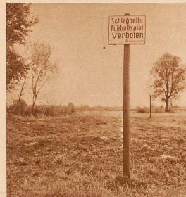
Zwei weitere Verbottafeln auf dem Tägermoosgebiet als Zeugen der eigentümlichen Grenzrechtsverhältnisse

DEUTSCHE VERBOTTAFELN AUF SCHWEIZERBODEN