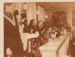
Die Jury, die über die Sportkostüme richtete