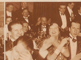
Rosy Dolly, eine der weltbekannten Dolly-Sisters, jetzt als Mrs. Irving-Netzel im Privatleben zurückgezogen, nahm ebenfalls an den Wettrennen der Eleganz teil und gewann den dritten Preis