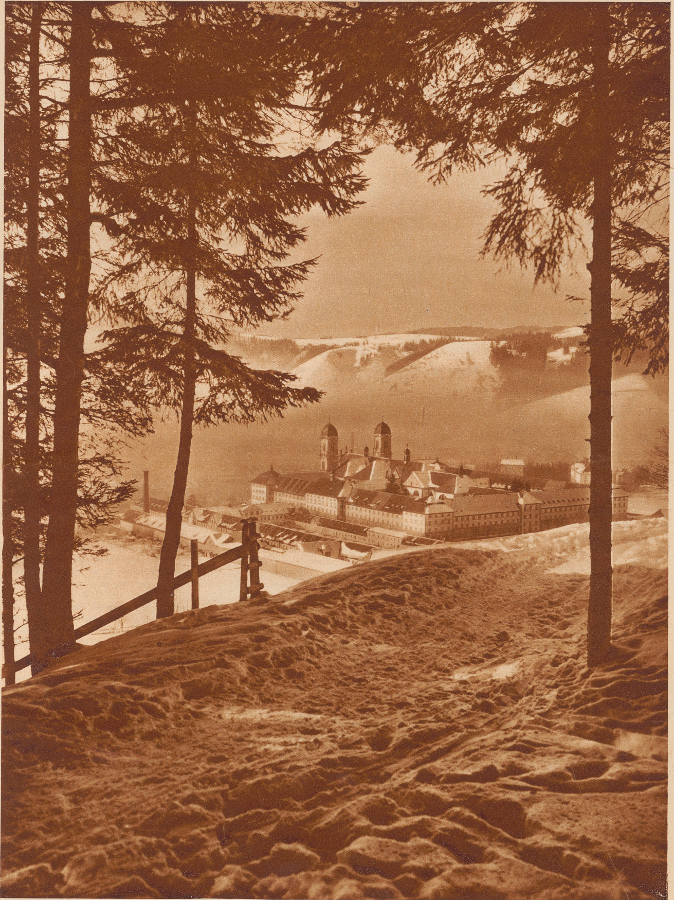
Vom 27.-29. Januar findet in Einsiedeln das 27. Schweizerische Skirennen statt