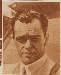
Der verschollene Flieger Bert Hinkler , der zum letztenmal über den Schweizer Alpen gesichtet wurde und nach dessen Verbleiben in jüngster Zeit so eifrig geforscht wurde. Hinkler ist Australier. Er flog seinerzeit als Erster direkt von Südamerika nach der afrikanischen Westküste

Am 24. Dezember 1932 verkündete der Papst dem versammelten Kardinalskollegium, daß er das Jahr 1933 zu einem außerordentlichen Jubeljahr, einem Anno Santo, bestimmt habe. Bei seiner Gründung im Jahre 1300 war das Anno Santo ursprünglich als all-hundertjährige Feier gedacht; seit 400 Jahren wird es in Intervallen von 25 Jahren (letztesmal 1925) gefeiert. Der Grund für dieses außerordentliche Jubeljahr ist der, daß von der überwiegenden Zahl der Gläubigen das Jahr 1933 als 1900. Wiederkehr des Todesjahres Christi angenommen wird, da sie von der nicht beweisbaren Voraussetzung ausgehen, daß Christus in seinem 33. Jahr den Tod erlitt. – Bild: Der Papst verkündet den päpstlichen Würdenträgern die Bulle des Anno Santo