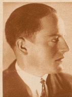
Ein junger Lebensretter