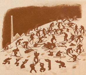
Die einsame Wiese in der Nähe der Stadt