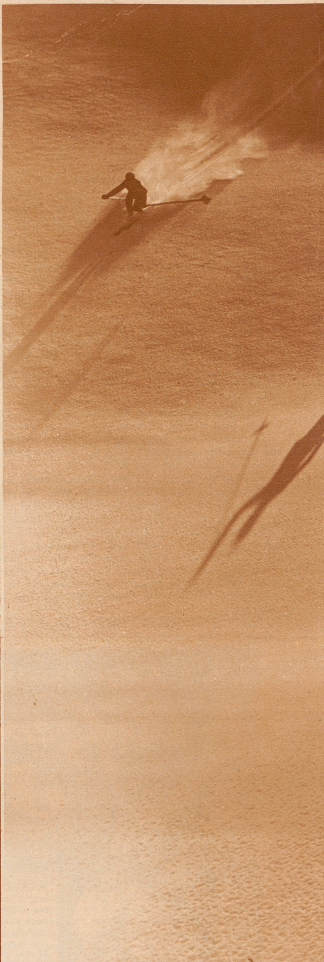
Im Skiparadies von Parsenn