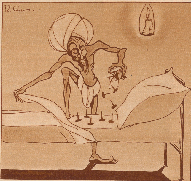
Indien. Schlafmittel für Fakire