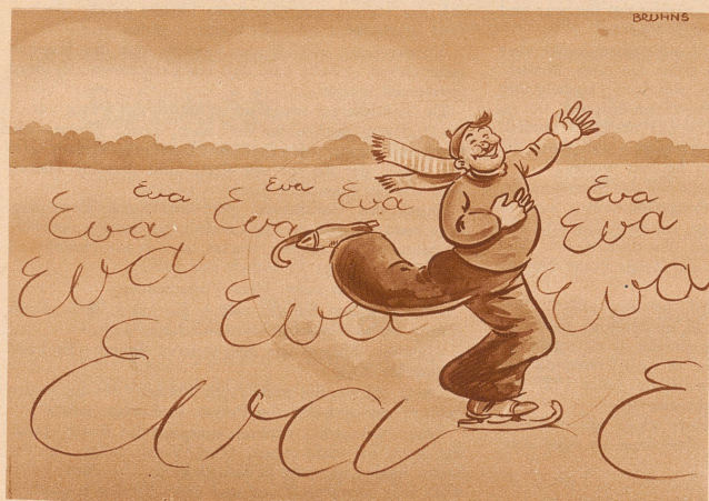
Der verliebte Kunstisläufer

Der Tiger schmierte sich an die nackten Schultern der schönen Frau des Weltreisenden. Es war ein Prachtexemplar, ein berühmter Menschenfresser aus den Dschungeln von Bengalen. Er war mit Crêpe de Chine gefüttert. Das ist die sicherste Art einen Tiger zu zählen.