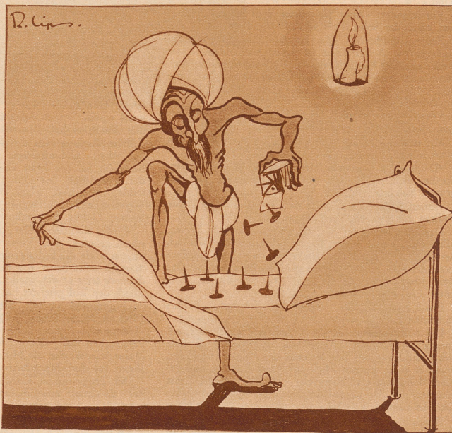
Indien. Schlafmittel für Fakire