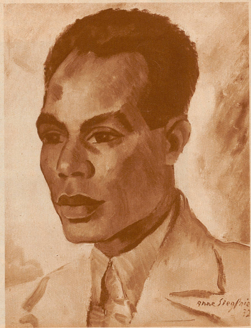
ZÜRICH Arne Siegfried: Bildnis Mr. P. St. Jean Louis. Aus der Ausstellung der Galerie Wolfsberg «Was bringt heute die Schweizer Kunst?»