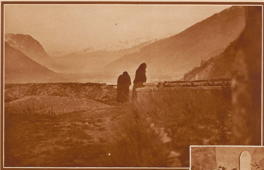
Rainer Maria Rilkes Grab

Die Einwohner von Raron waren sehr erstaunt, als ihnen zu Ohren kam, daß der blass kleine Herr, der da so manchesmal den Weg vom Bahnhof hinauf zur Kirchenterrasse geschritten, ein großer und berühmter Dichter gewesen sei. Mit ehrfürchtiger Verwunderung vernahmen und erfüllten sie seine letztwillige Verfügung, wonach er dort oben auf ihrem Friedhof an einer von ihm genau bestimmten Stelle begraben sein wollte. Von dieser Stätte schrieb Rilke selbst: «Seine Einfriedigung gehört zu den ersten Plätzen, von denen aus ich Wind und Licht dieser Landschaft empfangen habe zusammen mit all den Versprechungen, die sie mir, mit und in Muzot, später sollte verwirklichen helfen». Das Grab steht allein auf der Talseite der Kirche, auf der Bergeite ruhen die Toten des Dorfes. Auf dem Grabstein, der Wappen und Namen des Dichters trägt, steht eingemeißelt: Rose, o reiner Widerspruch, / Lust, niemandes Schlaf zu sein / Unter so viel Lidern