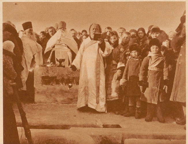
Die Segnung der Gewässer. Eine uralte Zeremonie der russischen griechisch-orthodoxen Kirche, die hier von russischen Emigranten in Charbin (Mandschurei) begangen wird. Ein Priester liest die Messe und schwingt das Rauchfaß, während der Metropolit auf einem Altar von Eis die Zeremonie leitet