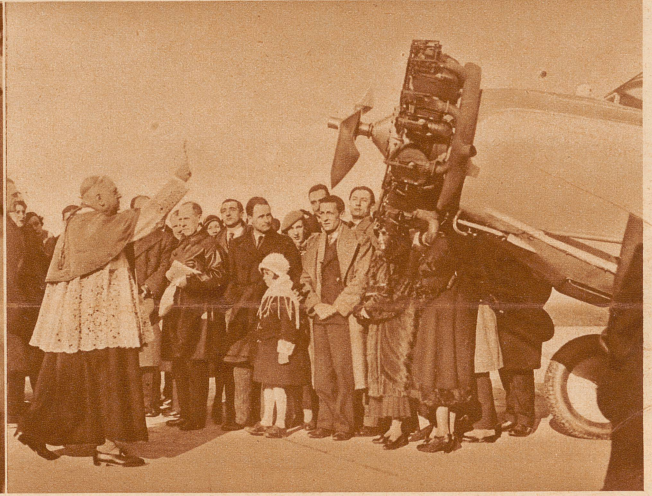
Der Segen für das Flugzeug. Bevor die beiden Langstreckenflieger Réginence und Lenier zum Fluge nach Madagaskar starteten, erhielt die Maschine auf dem Flugplatz von Orly den kirchlichen Segen durch Monseigneur Crepin, Bischof von Paris