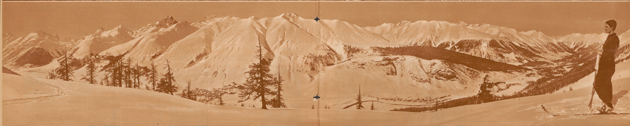
Landschaft im Winterkleid — Landschaft im Sommerkleid

Blick von der Alp «Il Nüd» am Südosthang über Zuoz auf das Innal. Ganz links im Bild das Dörfchen Ponte, der Ausgangspunkt des Albulapasses, in der Mitte des Bildes Zuoz, rechts Scans. Die höchste Spitze im Panorama links von Zuoz ist der Piz Kesch, 3420 Meter über Meer