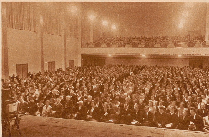
1300 Besucher beim ersten Jeklin-Konzert in Zürich. Das Verlangen nach guter Musik wird auch durch eine Zeit, die als kunstfremd und kunstfern geschmäht wird, nicht ausgetilgt. Die mancherlei Arten künstlicher Musikwiedergabe (Grammophon, Radio, Tonfilm) halten gewiß Viele vom Konzertsaal fern, wecken und mehren dafür bei vielen andern Sinn und Verständnis für die Tonkunst. Möglicherweise liegt ein Hauptgrund für den bedauerlichen Rückgang des Konzertbesuches in den oft übersehteten Eintrittspreisen. Die drei Jeklin-Konzerte dieses Winters stellen einen Versuch auf der Grundlage populärer Preise (Fr. 1.— bis 2.—) dar. Der große Saal des «Limmathauses» war anlässlich des Walter Gieseking-Abends ausverkauft. Im Februar findet am selben Ort ein Solisten-Abend von Stefi Geyer und im März ein Kammermusik-Abend von Elly Ney statt, für welche Veranstaltungen die Nachfrage bereits eingesetzt hat. Der Beweis, daß mit den Jeklin-Konzerten einem vorhandenen starken Bedürfnis Genüge geschieht, scheint erbracht zu sein.

Was an der Prospektor-Tätigkeit dran ist, weiß er längst. Ein Dreck ist dran! Der gute alte Tayne in New York ist ein Idiot! Hier und da stößt wohl mal ein Glückspilz auf ein Erzlager oder eine Goldader. Wenn schon. Das geschieht selten und meist gerade denjenigen, die keine Ahnung vom Work haben, Greenhorns, die sozusagen über einen Claim fallen. Mordsglück. Aber ein Esel, wer jahrelang dieser Chance nach-