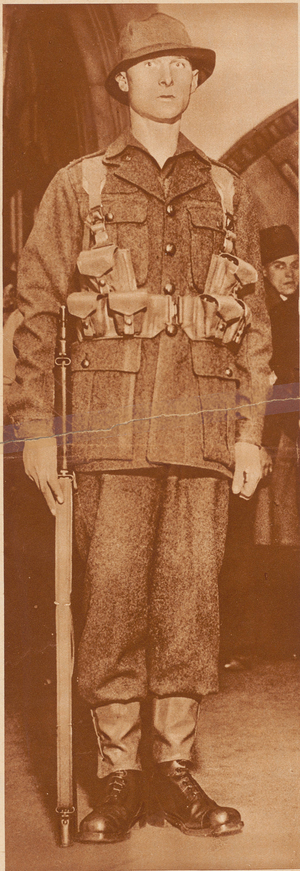
Die neue Uniform der englischen Infanteristen. In Scotland Yard fand in diesen Tagen unter Ausschluss der Öffentlichkeit eine große «Modeschau» zum Zwecke der Neuuniformierung des britischen Landheeres statt. Für jede einzelne Waffengattung wurden eine ganze Anzahl Uniformtypen den Sachverständigen vorgeführt. Unser Bild zeigt die neue Uniform, die für den englischen Infanteriesoldaten als am zweckmäßigsten befunden und angenommen wurde.