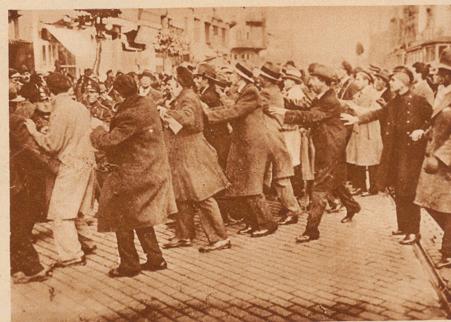
in Sofia: Die nationalen Studenten demonstrierten gegen den Friedensvertrag von Neuilly; als die Polizei gegen sie vorging, kam es zu schweren Tötlichkeiten. – Bild: Die Polizei versucht ohne Erfolg, die Demonstranten auseinanderzutreiben