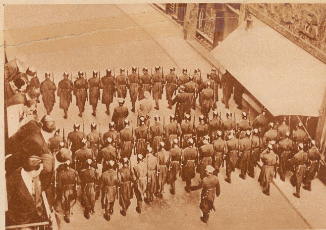
in Bukarest: Die National-Liberalen, die in Opposition zur jetzigen rumänischen Regierung stehen, demonstrierten in den Straßen der Hauptstadt; als die Demonstranten bis zum königlichen Schloß vordringen wollten, ging Polizei und Gendarmerie vor und riegelte sämtliche Zugangsstraßen ab (Bild), wobei es zu heftigen Zusammenstößen kam