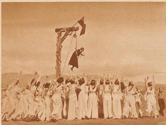
«Le roi Pausole.» Gleichzeitig mit dem «Don Quijote» wird an der französischen Riviera unter der Regie Granowskys und mit Emil Jannings in der Hauptrolle der Film von dem Märchenkönig Pausole gedreht, der für jeden Tag im Jahr eine Frau hat, — 366 Frauen, denn auch der Schalttag wird mitgezählt. 366 Frauen, die jüngsten, die schönsten, toben also durch diesen Film, der dadurch einer der anmutigsten des Jahres zu werden verspricht. — Eine Szene des Films: Das Frauenheer neckt einen Diener des Gebieters