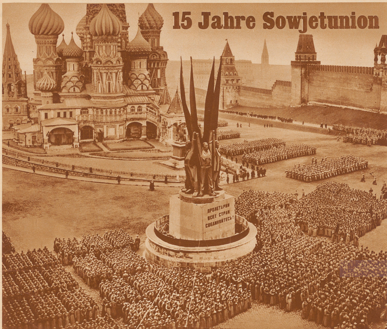
Die Revolutionsfeier, wie sie in Moskau alljährlich am 7. November begangen wird, wurde dieses Jahr gleichzeitig zum Jubiläum des 15jährigen Bestandes der Sowjetunion. Auf dem Roten Platz in Moskau fand bei dieser Gelegenheit eine riesige Parade der Roten Armee vor ihrem Führer Woroschilow statt. — Bild: Aufmarsch von Rotarmisten auf dem Roten Platz in Moskau, rings um das kürzlich errichtete Revolutionsdenkmal, auf dessen Sockel die Inschrift zu lesen ist: «Proletarier aller Länder, vereinigt Euch»