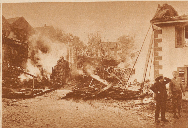
Großfeuer im Solothurnischen Schwarzbubenland. In der Nacht vom 3. zum 4. November sind im Dorfe Nunningen drei zusammengebaute Wohnhäuser samt Scheunen niedergebrannt. Fünf Familien sind obdachlos geworden. Der Gebäudeschaden beläuft sich auf 40 000 Franken. Außerdem blieben große Futtermittel und das gesamte Mobiliar in den Flammen. — Blick auf die Brandstätte am Morgen nach dem Brande