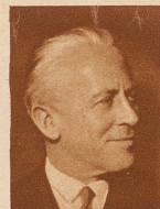
Oberst E. Armbruster Lithographiebesitzer in Bern, starb 60 Jahre alt. Mehrere Jahre war er Präsident des Vereins Schweizerischer Lithographiebesitzer und gehörte einige Amtsperioden dem Stadtrat und dem Großen Rat an. Als Platzkommandant von Bern schloß er vergangenes Jahr seine militärische Karriere ab

der derzeitige Vizepräsident des Nationalrates, Präsident der katholisch-konservativen Partei der Schweiz und Mitglied der Völkerbundscommission für moralische Abrüstung, ist von allen seinen Ämtern zurückgetreten und hat sich in ein französisches Benediktinerkloster zurückgezogen