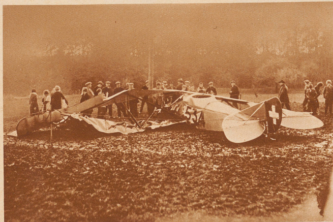
Flugzeugabsturz. Zwischen Pratteln und Augst stürzte der Meteorologe des Flugplatzes Basel, Oberleutnant Böttcher, mit einer Militärschulmaschine, die er nach Dübendorf überführen sollte, ab. Der Unfall ist auf eine Motorpanne in sehr geringer Höhe zurückzuführen. Die Maschine ging in Trümmer, der Pilot erlitt einen Oberschenkelbruch