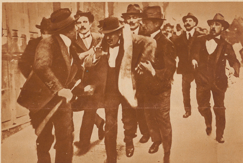
1903: Der Sozialist Mussolini. Der spätere bitterste Feind und Bekämpfer des Sozialismus war von seinen frühen Volksschullehrer-Tagen an, von 1902, selbst Sozialist und blieb es bis zum Ausbruch des Weltkrieges, in dem er im Gegensatz zur sozialistischen Partei für den Eintritt Italiens in den Krieg eintrat. Unsere Aufnahme zeigt die Verhaftung des jungen Sozialisten bei einer Straßendemonstration

Und weiter wird berichtet, wie der Duce mit einigen Politikern in Lausanne den Grand Pont überquerte und dabei bemerkte: Einmal bin ich nicht im Palace-Hotel abgestiegen, sondern habe unter den luftigen Bögen des Grand Pont übernachtet... So ändern sich die Zeiten!