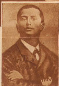
tung kennt man aus mancher hochoffiziellen Photographie des Duce

1897: Mussolini 14jährig Das früheste Jugendbild des Mannes, der jetzt über ganz Italien hin so viel abgebildet wird, wie kaum ein Mensch vor ihm. Die energische und gleichzeitig repräsentative Kopf- faltung kennt man aus mancher hochoffiziellen Photographie des Duce