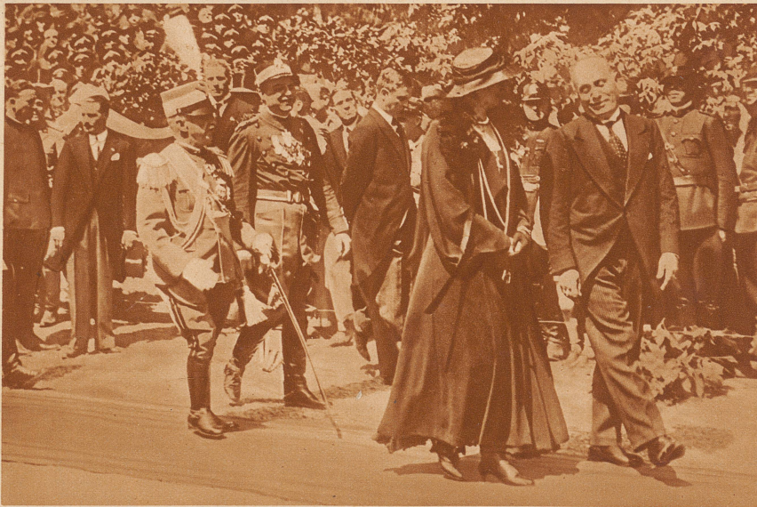
1932: Der Offizielle. Der Diktator Italiens im Gespräch mit der Königin