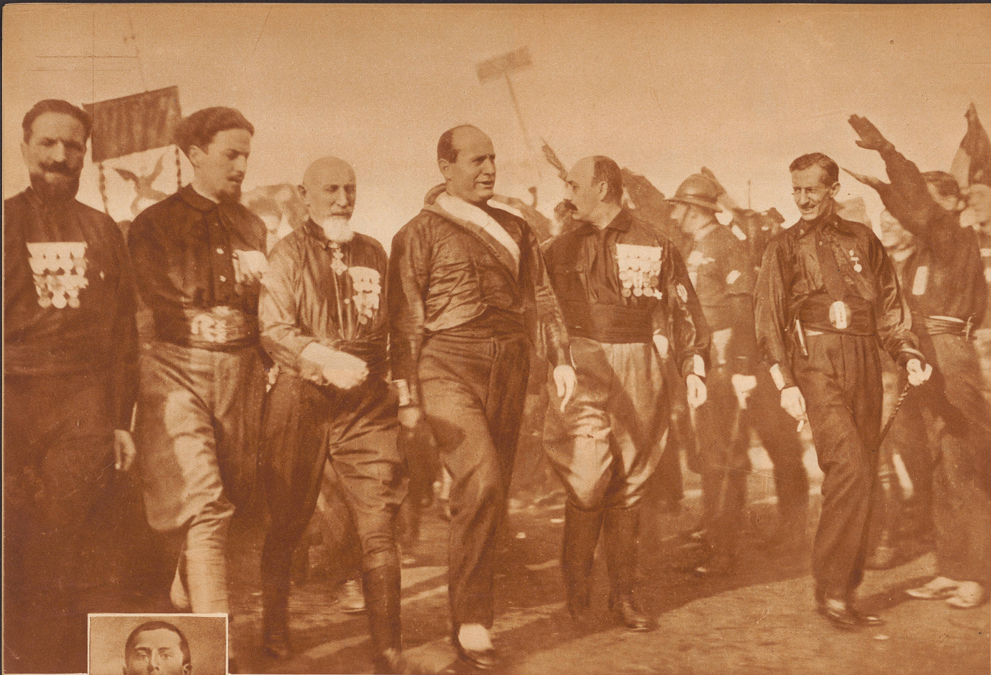
1922: Der Marsch auf Rom. Mussolini an der Spitze seiner schwarzen Armee an dem entscheidenden Punkt der Machtergreifung, dem Marsch auf Rom, 26. – 30. Oktober 1922. An seiner Seite der alte General de Bono und der jetzige Luftfahrtsminister Balbo