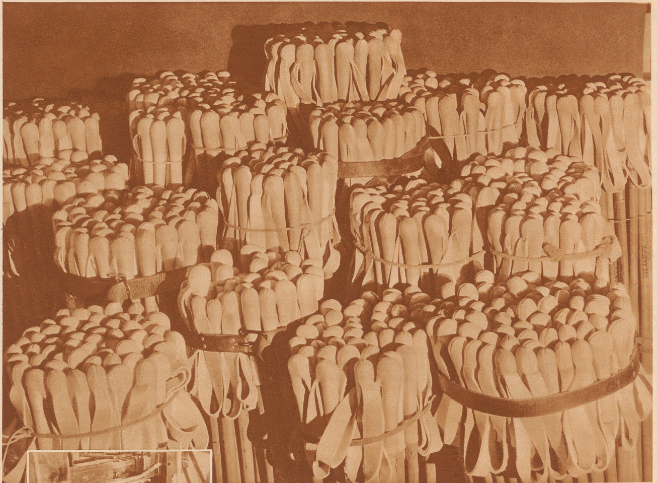
Keine Spargeln oder Lauchbüschel, sondern ein Lager gebrauchsfertiger Skistöcke zum Versand bereit