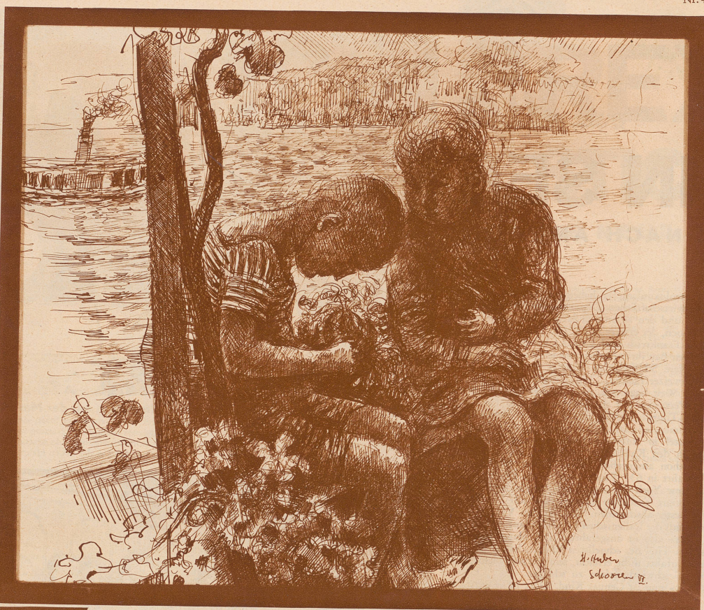
Federzeichnung von Hermann Huber: