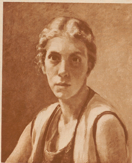
Oelgemälde von Alfred Marxer:

Eine Verlosung gibt jedem die Hoffnung, für bescheidenes Geld ein Bild zu gewinnen. Plastik, Oelbilder, Aquarelle, Zeichnungen, graphische Blätter warten auf Liebhaber, die es sich leisten können, sich selbst zu beschenken und anderen zu helfen.