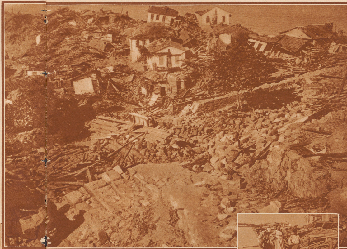
Die zerstörte Eisenerzmine von Stratoniki an der Chalkidike von Chalkidike.