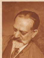
Emil Orlik gestorben.

Wenige Tage nach Max Slevogt starb dessen bester Freund und Zuhilgenosse Emil Orlik, 63-jährig, ein Maler, Graphiker und Radierer von ausgeprägter Eigenart. Als origineller Buchillustrator machte sich Orlik auch in breiten Schichten der Öffentlichkeit bekannt. Während 27 Jahren wirkte er als Lehrer an der Vereinigten Staatsschule für freie und angewandte Kunst in Berlin.