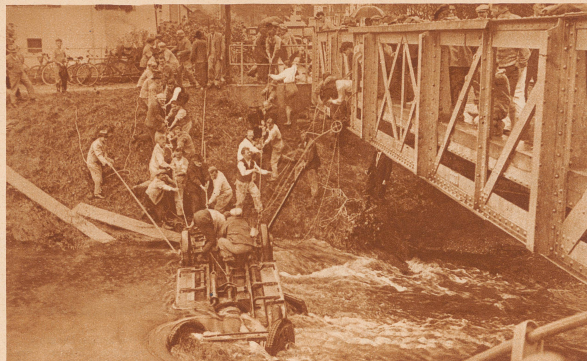
Schweres Autounglück. Letzten Montag ereignete sich in Buchs (Rheintal) ein schweres Autounglück. Ein mit vier Personen besetztes Auto, das von der Rheinbrücke herkam, mußte eines Radfahrers wegen plötzlich bremsen. Dabei geriet es auf der nassen Straße ins Schleudern, überschlug sich und stürzte in den werdenbergischen Binnenkanal. Zwei Insassen konnten sich durch Einschlagen der Autofenster retten. Die andern blieben im Wagen gefangen und konnten nur nach großen Bemühungen aus dem Wageninnern herausgeholt werden. Der eine der beiden Verunglückten erlag wenige Stunden nach der erfolgten Rettung den erlittenen Verletzungen. Unser Bild zeigt die Rettungsmaßnahmen und die Bergung der beiden noch im Auto befindlichen Opfer.