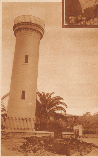
Der gefährdete Leuchtturm von Golf Juan. Durch Springfluten ist die Uferstraße längs des Meeres so beschädigt worden, daß der Leuchtturm von Golf Juan in gefährliche Schiefstellung geriet. Er mußte außer Betrieb gesetzt und verlassen werden, denn die Gefahr des Einsturzes besteht weiter.

Nordgriechenland und ein Teil des ägäischen Inselgebietes sind von einem schlimmen Erdbeben heimgesucht worden. Am schwersten sind die Stadt Saloniki und die Halbinsel Chalkidike betroffen. Nach amtlichen Schätzungen sind rund 3000 Gebäude gänzlich zerstört, 300 Menschen umgekommen, 10,000 obdachlos. — Ein orkanartiger Sturm verbunden mit schweren Wolkenbrüchen ist über das Küstengebiet von Südfrankreich niedergegangen. Der durch Springfluten in den Häfen zwischen Marseille und Cannes und durch Ueberschwemmungen im Hinterland angerichtete Schaden beläuft sich auf mehrere Millionen Franken.