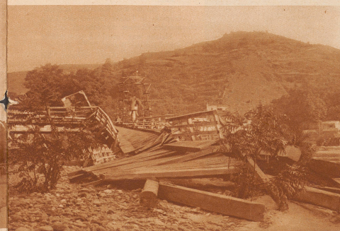
Durch Hochwasser zerstörte Brücke über einen Rhone-Zufluß bei La Vouite in der Gegend von Valence (Südfrankreich).