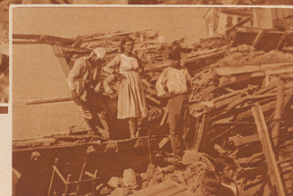
Rechts: Obdachlos gewordene Einwohner von Hierissos auf den Trümmern ihrer zerstörten Häuser. Hierissos liegt an der Grenze der Mönchsrepublik Aghion Oros (Berg Athos).