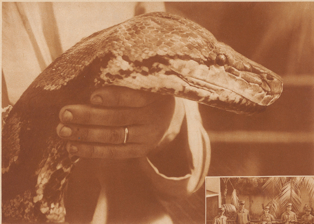
Der Kopf der Riesenschlange