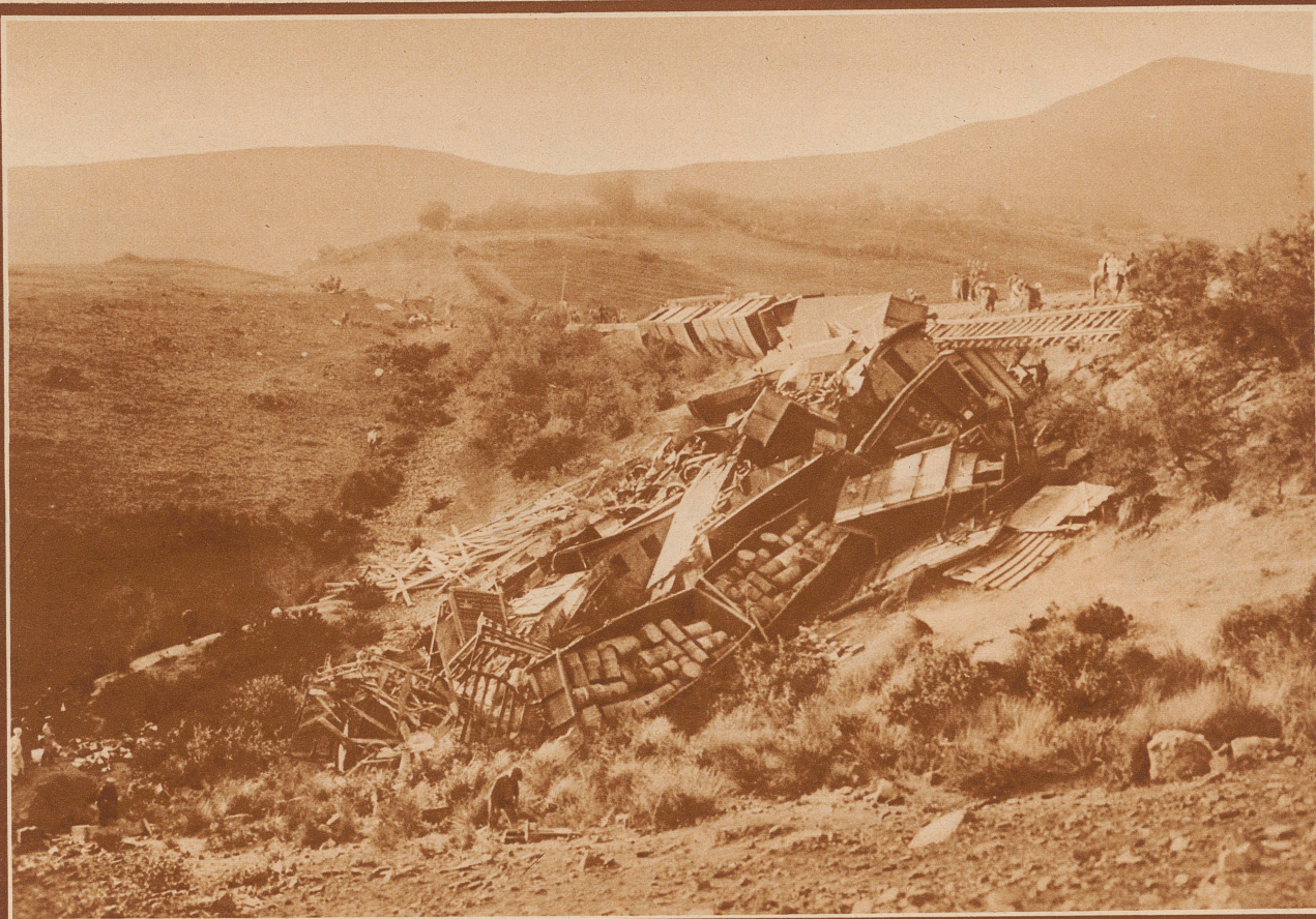
Schwere Zugkatastrophe in Algier. Auf der Linie von Oran nach Oudjda bei der Station Tlemcen ereignete sich ein Zugunglück von riesigen Ausmaßen. Auf dem durch heftige Regengüsse schadhaft gewordenem Bahnunterbau entgleiste ein Militärzug der Fremdenlegion und stürzte über einen 30 Meter hohen Abhang in die Tiefe. 61 Legionäre und 5 Mann vom Zugpersonal kamen ums Leben