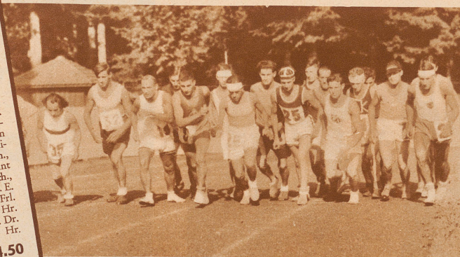
Die Schweizerische Marathon-Meisterschaft in Bern.

Die «Zürcher Illustrierte» Abonnement- Insertionspreis