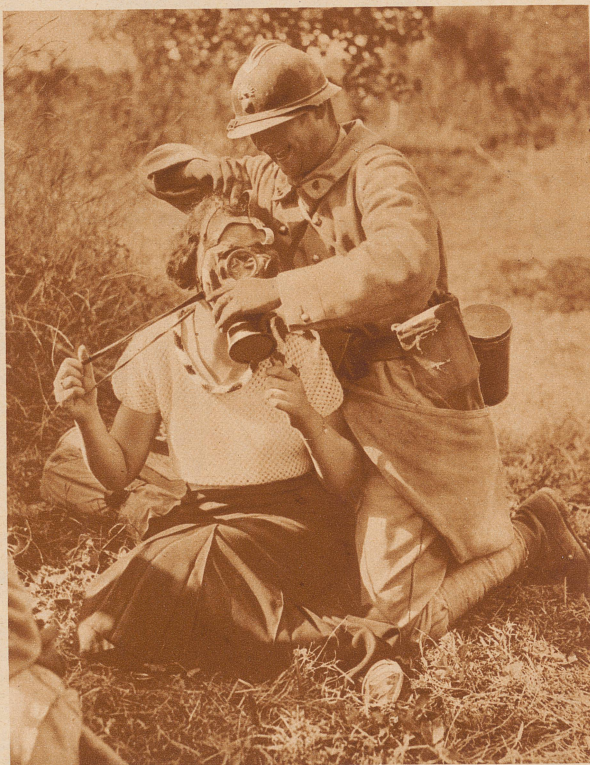
Spiel und Flirt mit der Gasmaske. Dieses Bild – aufgenommen an den französischen Herbstmanövern in der Champagne – stimmt nachdenklich. Es erinnert erneut daran, wie groß die Kindlichkeit der Menschen ist und wie groß ihre Fähigkeit zum Nicht-Nachdenken