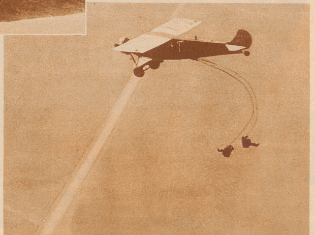
So sieht der «Absprung im Sessel» aus. Die beiden dunklen Linien sind die Seile der Fallschirme, die unten an den Sitzen angebracht sind. Jetzt sind sie noch mit dem Flugzeug verbunden. Bald aber werden sie zerreißen und in dem Augenblick entfaltet sich der Fallschirm

bauen, daß sie durch einen Druck auf einen Hebel aus der Flugzeugkabine heraus und in den Luftraum herausgeschleudert werden, — natürlich mitsamt den Menschen, die darin sitzen. Nach ein paar Sekunden öffnen sich dann die Fallschirme, die unten an den Sitzen angebracht sind, und tragen die Stühle samt den Menschen in langsamem Schweben sanft zur Erde. Selbstverständlich sind die Passagiere an den Sitzen angeschnallt, so daß sie unmöglich herausfallen können. In Zukunft kann sich also ein Passagier nicht mehr lange überlegen: wag ich's oder wag ich's nicht? Der Pilot dreht, wenn Gefahr ist, einen Hebel, — und schon schwebt man mit seinem Stuhl der Erde entgegen. Die Furchtsamen wird man gar nicht mehr von den Mutigen unterscheiden können.