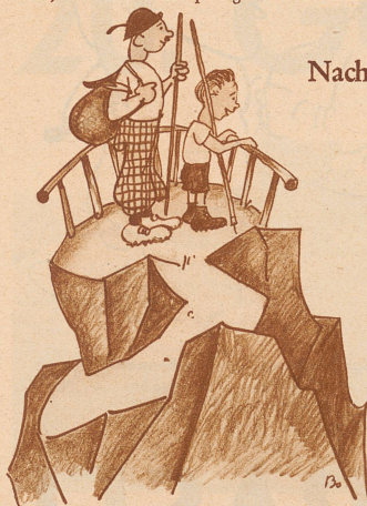
Max, der seine Ferien in den Bergen zubrachte, erzählte einem Freund: «Ich bin mit em Vater uf eme höche Berg gsi, uf d'r einte Site isch d'Schwiz gsi, aber wänn ich uf d'r andere Site abegfalle wär, hetted's mi scho in Italie begrabe!»