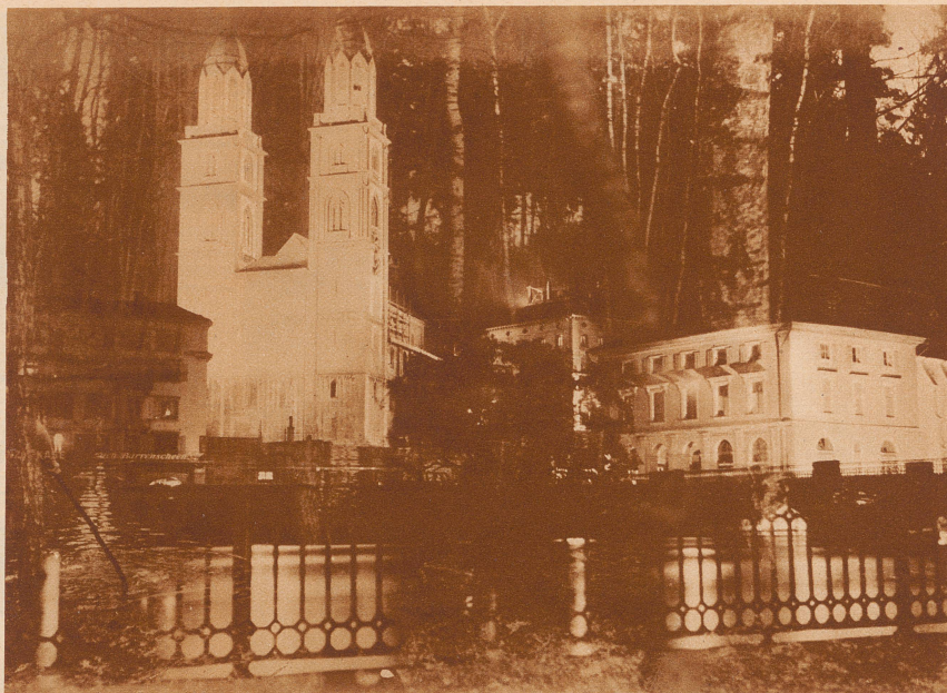
Zürich, als es noch im Urwald stand

Kaserne. «Kurotschkin, warum sind Ihre Füße so schmutzig?» «Von den Socken, Genosse Befehlshaber.» «Und die Socken? Warum?» «Vermutlich von den Füßen, Genosse Befehlshaber.»