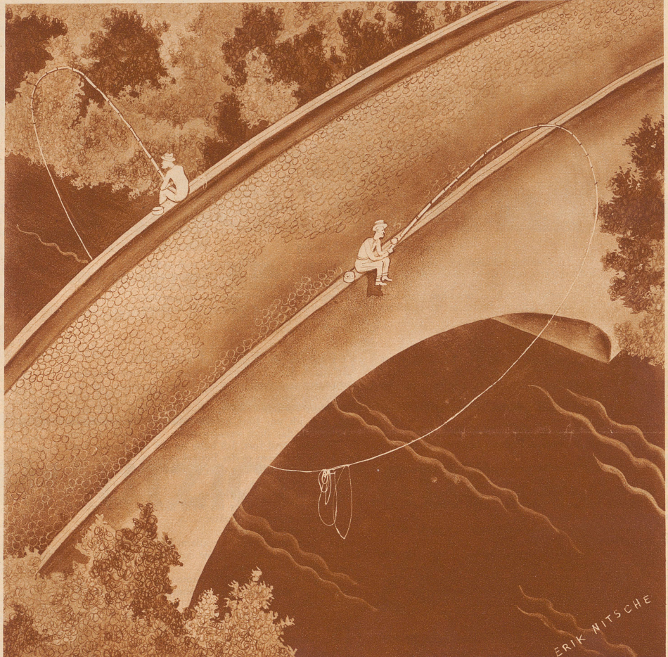
Die beiden Angler zugleich: «Aha, es beißt an!»

«Sitztst du nicht in Zugluft? Hat niemand in