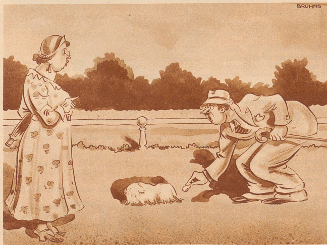
Das neue Hündchen. «Aber, Oskar! Das ist ja das verkehrte Ende!»

deiner Nähe einen kalten Zigarrenstummel im Mund?»