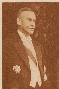
Minister Künzl-Jizerski, der neue Gesandte der Tschechoslowakei in Bern.