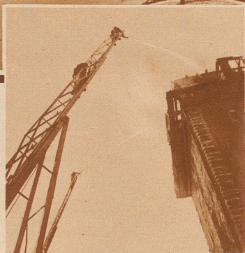
Die Feuerwehr an der Arbeit. Der Kampf gegen das Feuer konnte nur von außen her geführt werden, da das wie ein Kamin wirkende Turminnere in Flammen stand. Der sehr massive, steinerne Teil des Turmes blieb fast unbeschädigt, so daß mit einem Wiederaufbau des alten Bauwerkes gerechnet werden darf.

Am Vormittag des 22. September 1932 brach im Schwabentor, diesem wuchtigen Turm aus dem Mittelalter, Feuer aus. Eine im Dachstock wohnende Familie konnte im allerletzten Augenblick in Sicherheit gebracht werden. Der Turm brannte vollständig aus. – Der von den Flammen vernichtete Turmaufbau stammte aus dem 18. oder dem beginnenden 19. Jahrhundert. Das Schwabentor selbst jedoch stand schon im 14. Jahrhundert, im Jahre 1370 wird es zum erstenmal urkundlich genannt.