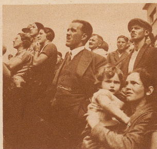
Die Zuschauer. Die Einwohner aller alten Schweizerstädte kennen sich aus in der Geschichte ihrer engern Heimat. Die alten Bauten werden darum mit Liebe betrachtet und geachtet. Auch die Schaffhauser liebten ihren Schwabenturm. Das Bedauern über den Brandfall ist daher allgemein und groß.