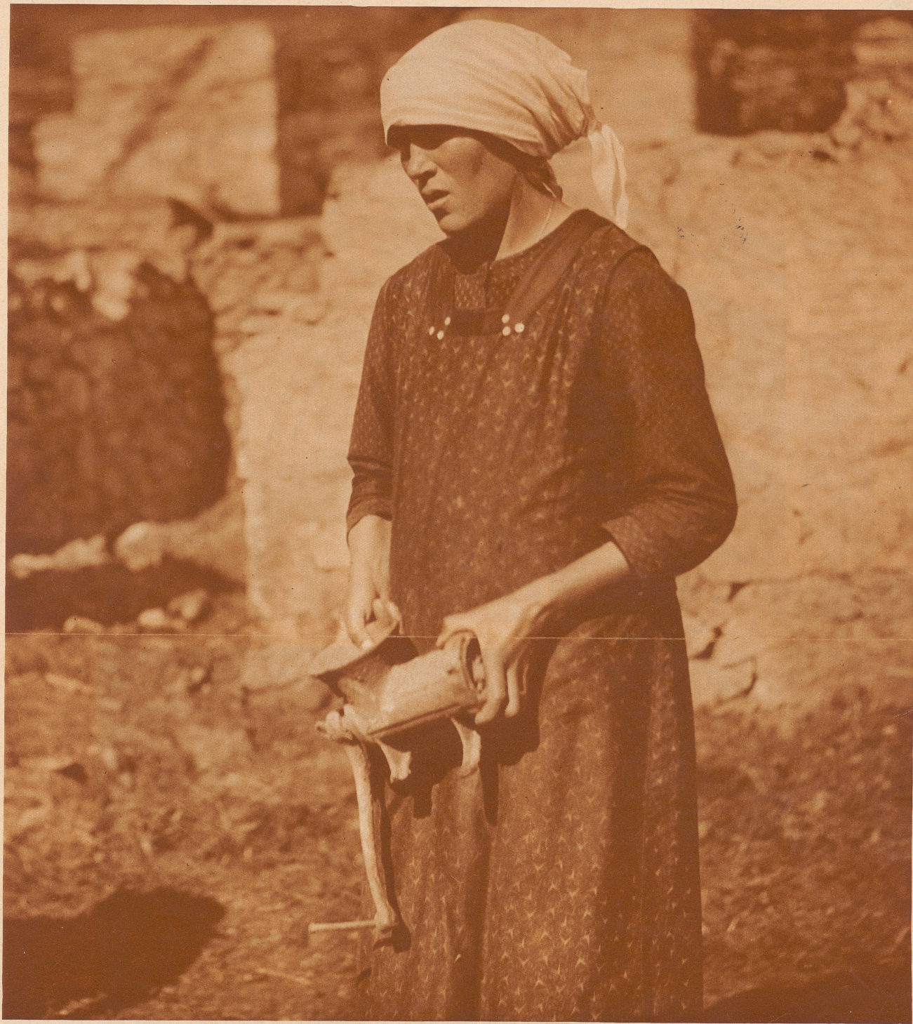
Das Ueberbleibsel. Diese Fleischmaschine ist das Einzige, was die Frau aus dem Feuer retten konnte. In ihrem Trostverlangen klammert sie sich an dieses eine Stück und ist froh, daß sie noch irgend etwas in Händen halten darf, das aus dem zerstörten Heime stammt.