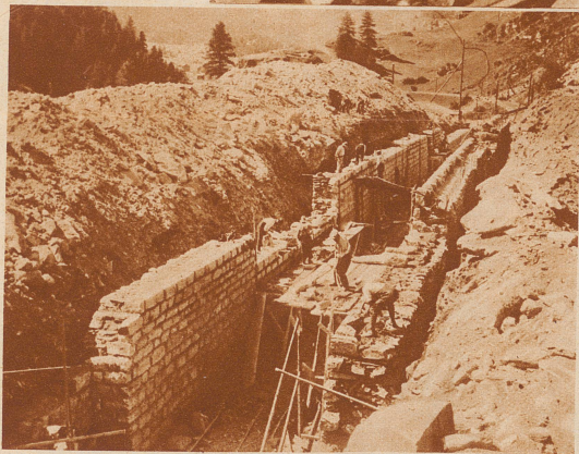
Der werdende Tunnel