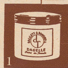
Perfect Cold Cream (Topf oder Tube)