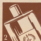
Vivatone (in Flaschen)