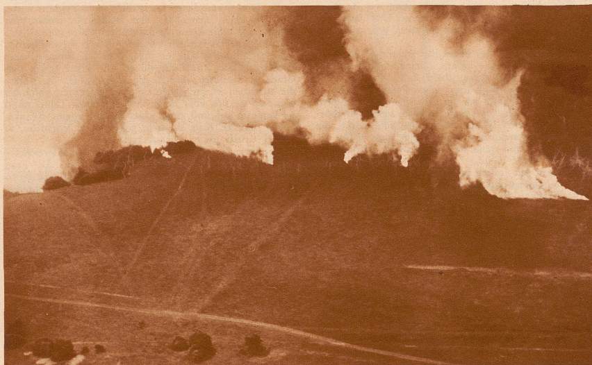
Die deutsche Reichswehr fabriziert Gewölk zum blauen Himmel. Es sind Vernebelungsübungen bei den Manövern