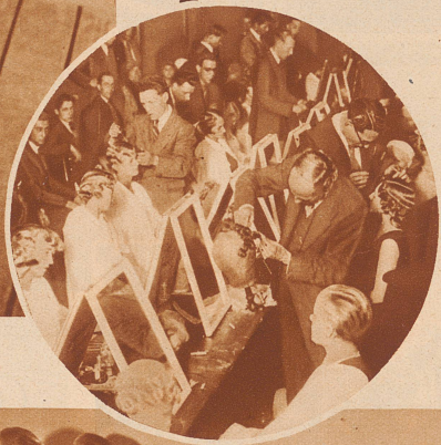
Trägerinnen der neuen Modfrisuren am großen Schaufrieren um den goldenen Pokal im 'St. James' Club in London