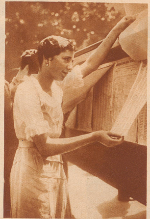
Zum erstenmal in Spaniens Geschichte wählen die Frauen: Ein junges Mädchen prüft die Wahllisten an den öffentlichen Anschlagstellen. Mit dem Wahlrecht der Frau ist ein ganz neuer Faktor in das politische Leben des Landes gekommen