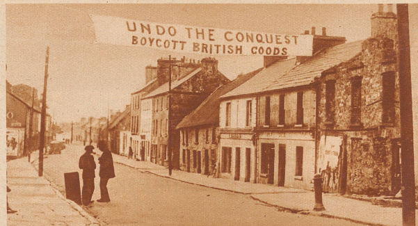
«Boycottiert britische Waren!» An der Wirtschaftskonferenz in Ottawa wird gegenwärtig über die verschiedenen Sorgen Groß-Britanniens und seiner Dominions beraten. Eine der größten dieser Sorgen ist augenblicklich die irische Frage, die sich immer mehr kompliziert und in einen unheilvollen Kreislauf gerät: Es begann mit der Weigerung Irlands, Annuitäten zu zahlen, worauf England hohe Einfuhrzölle für irische Waren schuf und den irischen Export ruinierte. Als Antwort fordert Irland überall im ganzen Lande zum Boycott britischer Waren auf. — Unser Bild zeigt ein Transparent in einem kleinen irischen Städtchen: «Macht die Eroberung ungeschehen!» (Gemeint ist die Eroberung Irlands durch England vor vielen hundert Jahren.) «Boycottiert britische Waren!»