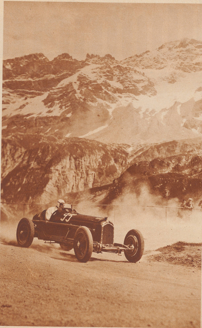
Caracciola in der Kurve. Der durch seine beispiellose Kaltblütigkeit sich auszeichnende Rennfahrer bringt die große Ueberraschung – er schlägt auf «Alfa Romeo» den bisherigen Klausenrekord von 16:24,6 und bezwingt die Strecke mit einem Durchschnittstempo von 82 km in 15 Minuten 50 Sekunden. Zu beachten ist, wie ganz anders Caracciola die Kurven nimmt. Schon in der Kurvenmitte hat er den Wagen vollständig in die neue Richtung umgedrückt