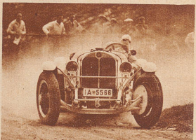
Der Rennfahrer Hans Stuck von Vilicz, Berlin, verbessert auf seinem 7 Liter-Sechszylinder «Mercedes-Benz» in der Zeit von 17:00,6 den 1930 von Caracciola aufgestellten Sportwagenrekord um 4 Sekunden