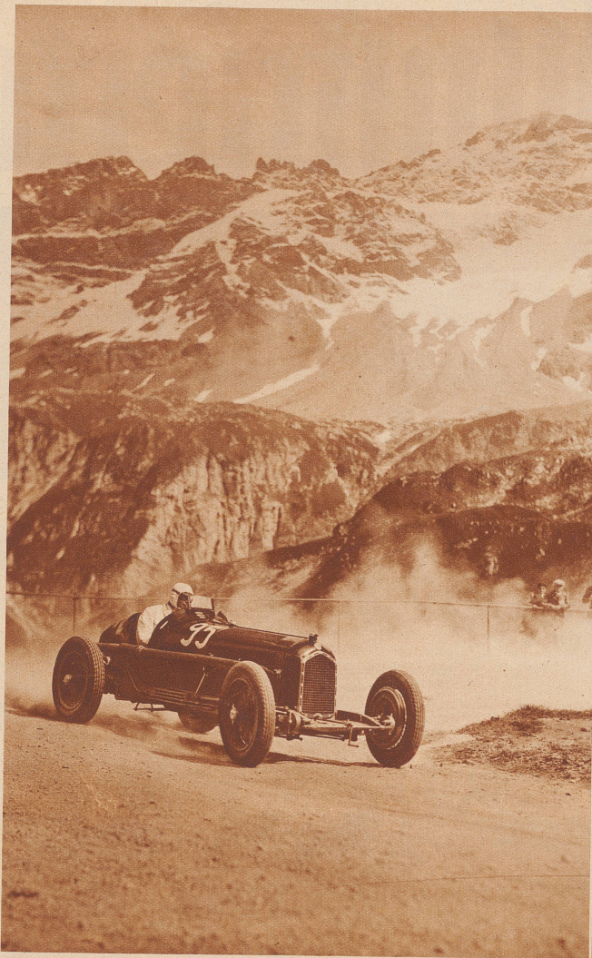
Caracciola in der Kurve. Der durch seine beispiellose Kaltblütigkeit sich auszeichnende Rennfahrer bringt die große Ueberraschung – er schlägt auf «Alfa Romeo» den bisherigen Klausenrekord von 16:24,6 und bezwingt die Strecke mit einem Durchschnittstempo von 82 km in 15 Minuten 50 Sekunden. Zu beachten ist, wie ganz anders Caracciola die Kurven nimmt. Schon in der Kurvenmitte hat er den Wagen vollständig in die neue Richtung umgedrückt