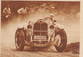
Der Rennfahrer Hans Stuck von Villiez, Berlin, verbessert auf seinem 7 Liter-Sechszylinder «Mercedes-Benz» in der Zeit von 17:00,6 den 1930 von Caracciola aufgestellten Sportwagenrekord um 4 Sekunden