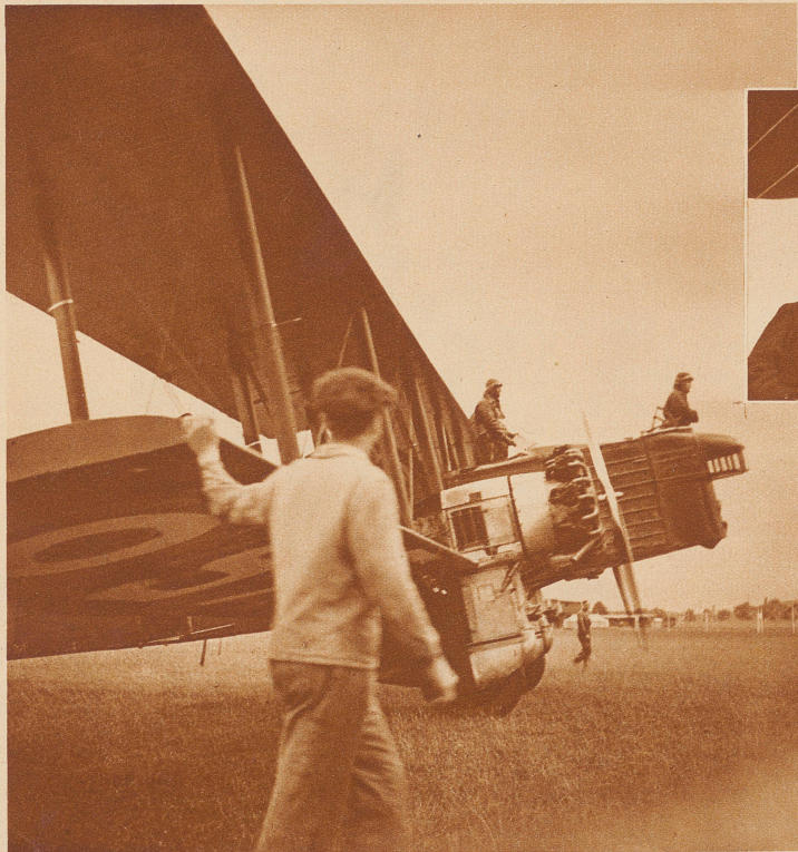
Eines von den sechs mächtigen Bombenflugzeugen, die Frankreich zu der internationalen Staffelflugkonkurrenz hergeschickt hat