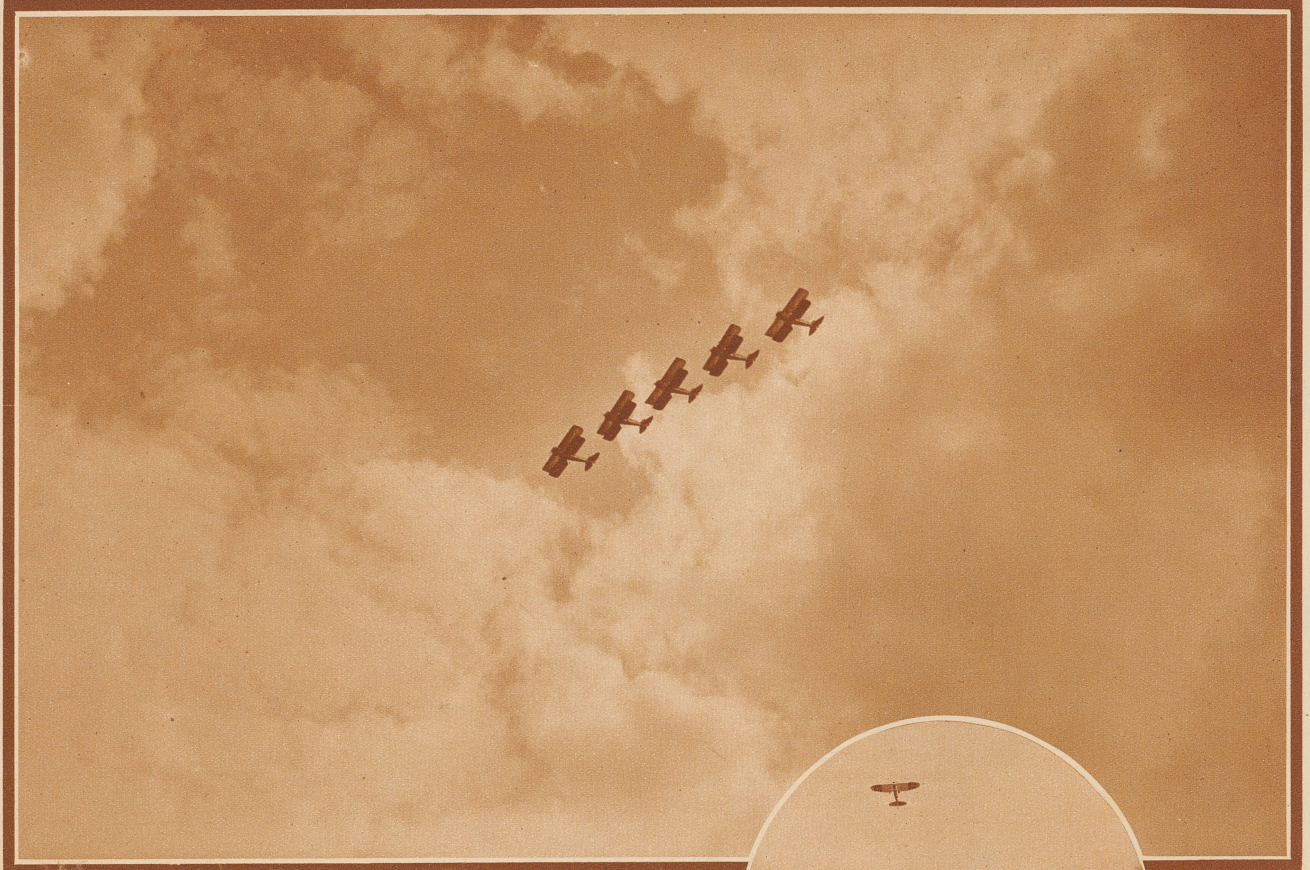
Italienische Militärfieger in einer Fünferstaffel zeigen in einer Höhe von 1000 m über dem Dübendorfer Flugfeld ihre berühmten akrobatischen Kunststücke