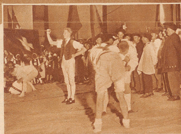
Szene aus dem 1. Akt des Festspiels: «Wie sie da die Fahnen schwingen! ... Die Schwinger treten zu naturalistischen Kämpfen an, und es ist köstlich, wie sie die Bühne vergessen und plötzlich aus dem Theater mitten in einen ernstgemeinten Hosenlupf fallen» Edwin Arnet in der N. Z. Z.