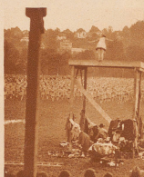
Die allgemeinen Übungen, woran sich gegen 5000 Turnerinnen beteiligten. Auf dem Gerüst steht die Vorturnerin. Aller Augen sind auf sie gerichtet