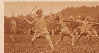
Speerwerferinnen. Der weibliche Körper kommt hier zu einer naturgemäßen und gleichzeitig ästhetische Gesetze erfüllenden Bewegung

Zum ersten Male seit dem Bestehen des Schweizerischen Frauenturnverbandes beteiligten sich dieses Jahr die Schweizer Turnerinnen an einem Eidgenössischen Turnfeste