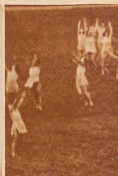
Basler Turnerinnen an rhythmischer Arbeit