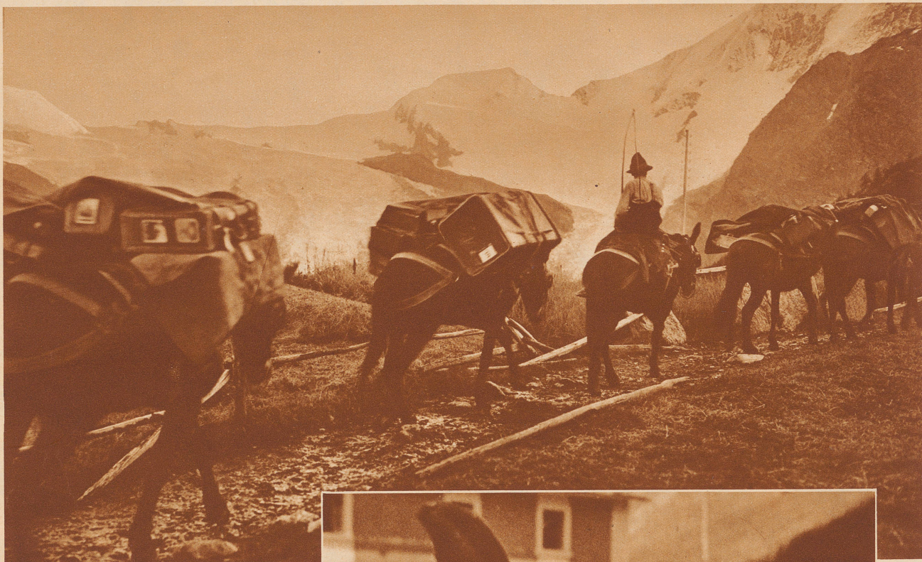
Eine Maultierpost-Kolonie im Saas-Tal im Wallis. Den ganzen Tag war sie unterwegs. Jetzt nähert sie sich dem Ziele: Saas-Fee. Im Hintergrund das Allalin-Horn, der Alphubel und das Täschhorn. Der Maultierpostillon reitet, gemütlich sein Pfeifchen rauchend, auf seinem Spezialreiter und hält mit fröhlichem Peitschenknall Ordnung in der Kolonne