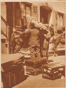
Rechts: Stalden, Station der Visp-Zermatt-Bahn ist Ausgangspunkt der Maultierpost ins Saas-Tal. Da werden die Tiere beladen mit Gepäckstücken jeder Art: Rohrplatten - Koffern, Warenkisten, Postsäcke etc. Rund 150 Kilo Nutzlast wird einem Maultier aufgeladen