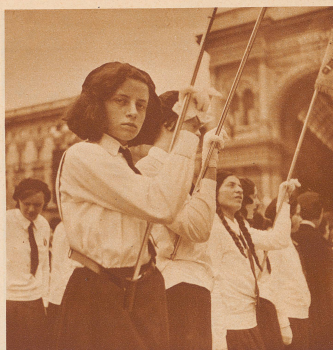
Fahnenträgerinnen der faschistischen Jungmädchen-Organisation