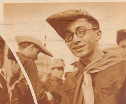
Faschistische Studenten. Die typische italienische Studentenmütze ist bei- gehalten worden