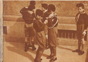
Balilla-Musketiere bei einer Dienstpauze