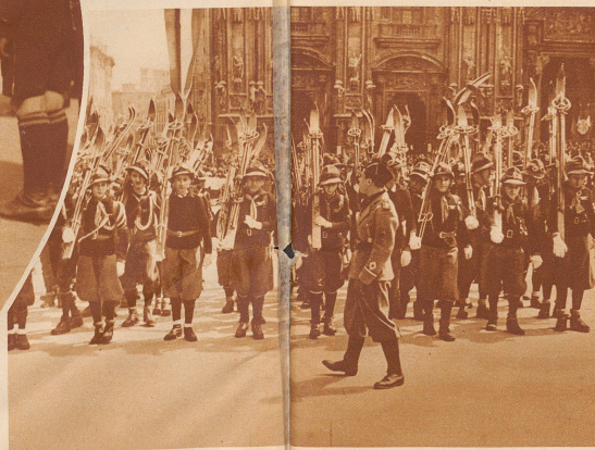
Faschistische Avanguardisten mit ge- stemmtem Skigerät auf dem Mailänder Domplatz