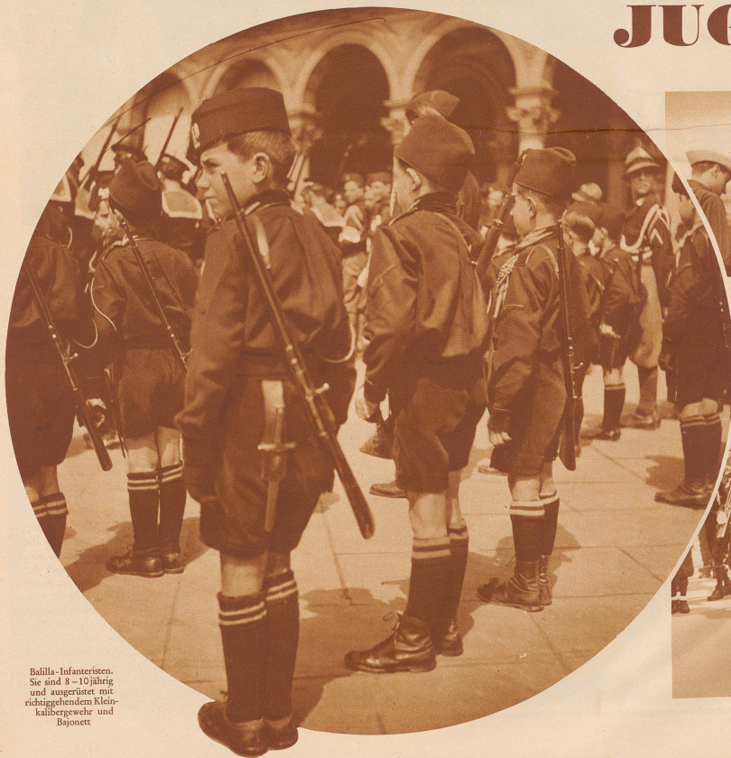
Balilla-Infanteristen. Sie sind 8-10-jährig und ausgerüstet mit richtiggehendem Klein- kalibergewehr und Bajonett