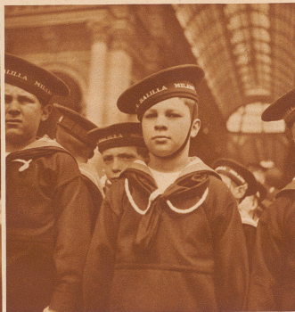
Marine-Balilla. Aus ihnen werden später die Schiffsjungen rekrutiert