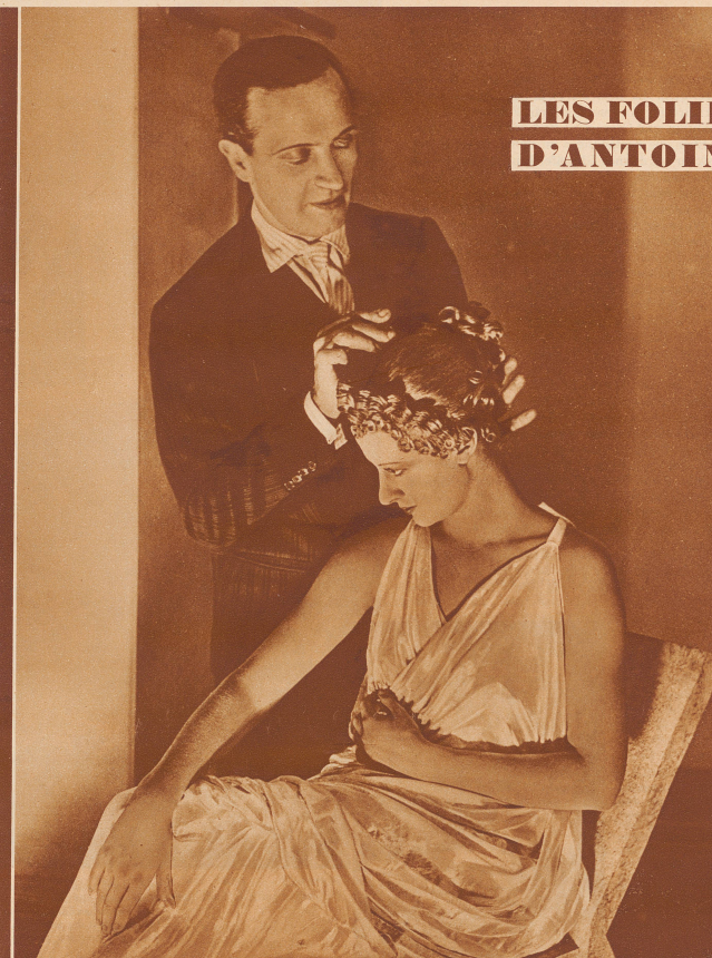
Antoine, der König der Friseure, beim Aufbau der neuen von ihm erfundenen griechischen Lockenfrisur

Wäre er nicht einer der an Erfolg und Geld reichsten Männer unserer Zeit, — man würde abschätzend an seiner seltsamen Erscheinung vorbeiziehen mit der kühlen Feststellung: Total verrückt. Aber — wie heißt es in dem Schlager, der, auch er, Erfolg gehabt hat: «... ein bißchen verrückt — ist das Schönste, was es gibt». Betrachten wir uns den Mann etwas näher, seine Erfolge und seine Tollheiten. Er ist es wert.