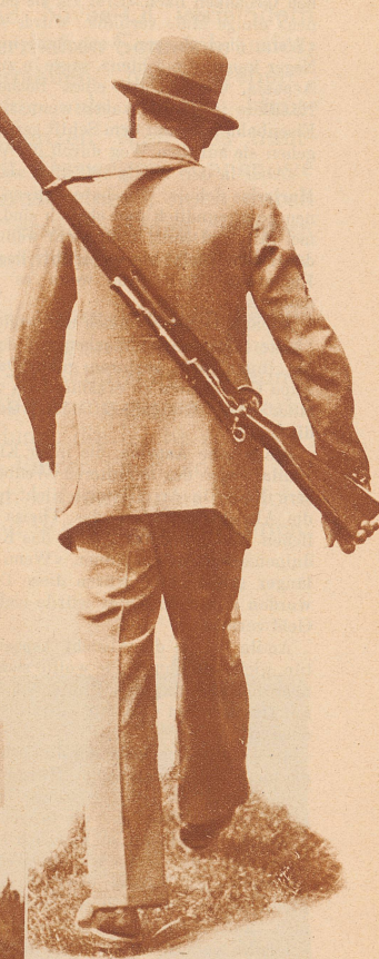
Das «Obligatorische» ist erfüllt, befriedigt zieht er nach Hause