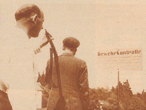
Gewehrkontrolle: Kein Schütze darf den Schießstand verlassen, bevor der Kontrolleur das Gewehr nachgesehen hat