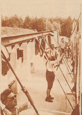
Die Zeiger an der Arbeit