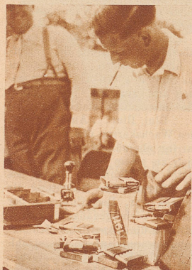
Der Munitionsverwalter in seinem Laden