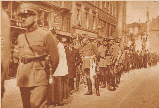
Bundesrat Minger (im Zylinder) und rechts von ihm Oberstkorpskommandant Wildbolz im Trauerzug