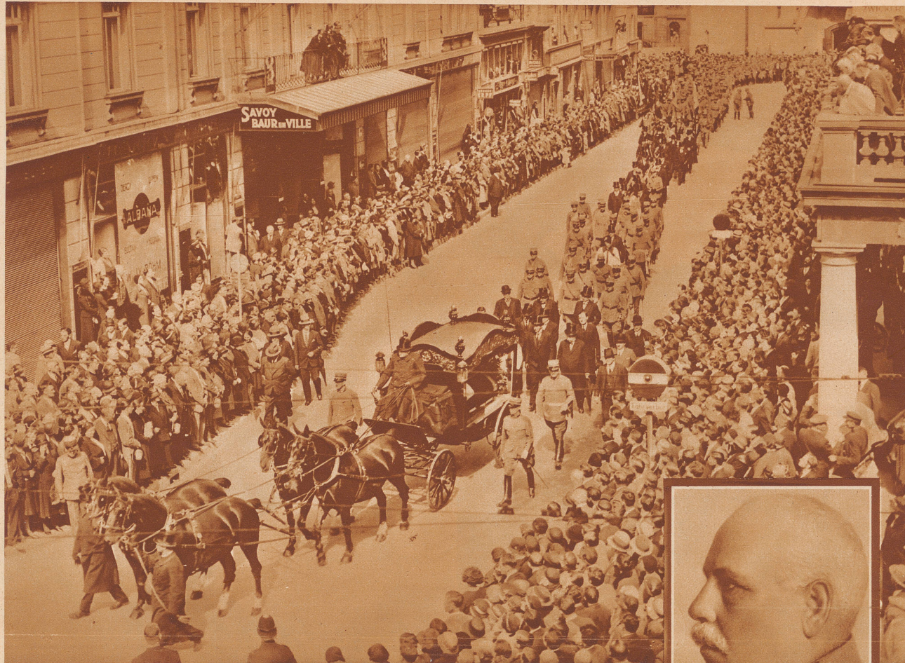
Der Trauerzug in der Poststraße. Vom Fraumünster bis zum Krematorium bildet zu Tausenden die Bevölkerung Spalir. Vier hohe Truppenführer schreiten neben dem Leichenwagen. Dem Sarge folgen die Angehörigen, der Korpsstab 2, Bundesrat Minger, der Chef des Militärdépartements, die Kommandanten der Heereseinheiten, die Waffen- und Abteilungschefs, die Militärattaches von Frankreich und Italien. Der Vorbeimarsch des Zuges dauerte 20 Minuten