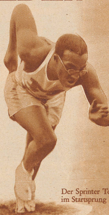
Der Sprinter Tolan im Startsprung

sen. Wenn die Amerikaner heute indianische Prärieläufer herbeiholen, um ihre Ueberlegenheit anlässlich der Olympischen Spiele von Los Angeles noch ausgeglichener zu gestalten, so bedeutet diese Erscheinung nichts anderes, als daß auch die Briten ohne weiteres berechtigt wären, aus ihren Kolonien oder Protektorsgebieten Steppenläufer und Wildleute heranzuholen, um sie im Wettkampfe für olympische Ehren einzusetzen. Es