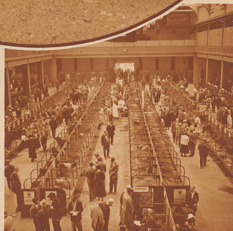
Blick in die Ausstellungshalle in der Mustermesse

A.: «Wundervolles Tier, ich schlage es für den 1. Preis vor!» B.: «Aber Herr Kollege, das ist ja ein alter Handwischer!»