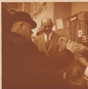
Bundesrat Motta, der Ehrenpräsident der Ausstellung, begrüßt einen Erstpreisträger