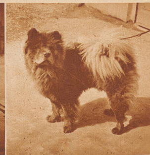
«Chang» erhielt den Siegertitel der Chow-Chow-Rasse. Er stammt aus der Linie des berühmten «Lenning», der für 50 000 Fr. verkauft wurde. Für den Bahntransport nach Basel war «Chang» für 25 000 Fr. versichert