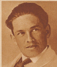
Dr. H. Binswanger von Kreuzlingen ist zum Chefarzt der kantonalen Heilanstalt Burghölzli ernannt worden.