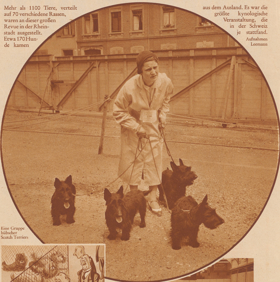
Eine Gruppe hübscher Scotch Terriers