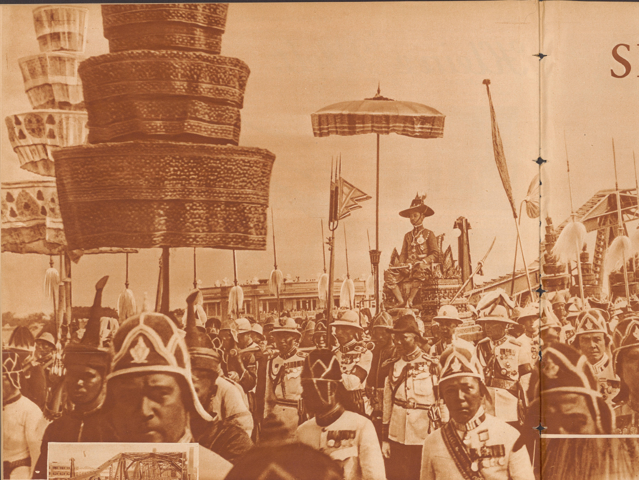
König Prajadhikop wird in seinem Thronessel über die neue Brücke getragen. Er trägt das Kleid seiner Vorfahren, des Königs Phra Buddha Yowd Fa Tschulok, seine Leibwache das Kostüm des 18. Jahrhunderts

Das Königreich Siam ist eines der wenigen Länder Asiens, das dank der klugen Politik seiner Herrscher bis heute seine Unabhängigkeit bewahren konnte. In diesem Land des weißen Elefanten regiert seit 150 Jahren die Tschakri-Dynastie, die von General Tschakri abstammt. Der gegenwärtige Herrscher ist König Prajadhikop, ein Mann mit ganz neuzeitlichen Regierungsmethoden. Anfangs April feierte er mit seinem Hofe das 150jährige Regierungsfest seiner Dynastie. Es war ein Fest, so farbenreich und phantastisch und voller Kontraste, wie es das nur im Orient geben kann. Seltam vermengten sich da östliche Pracht mit westlicher Technik, uralte, unverfälscht überlieferte Bräuche mit moderner Militärdisziplin. Kein Hof der Welt wäre imstande, ein Fest von solch vollendeter Schönheit und Harmonie zu zeigen.