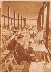
Der Zeremonienmeister des Hofes erklärt den ausländischen Gästen das Fest