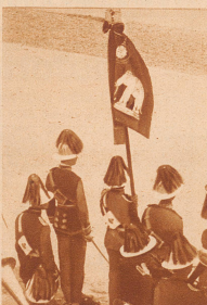
Die Regimentsfahne eines in Bangkok stationierten Infanterie-Regiments. Der weiße Elefant ist das Symbol des Landes