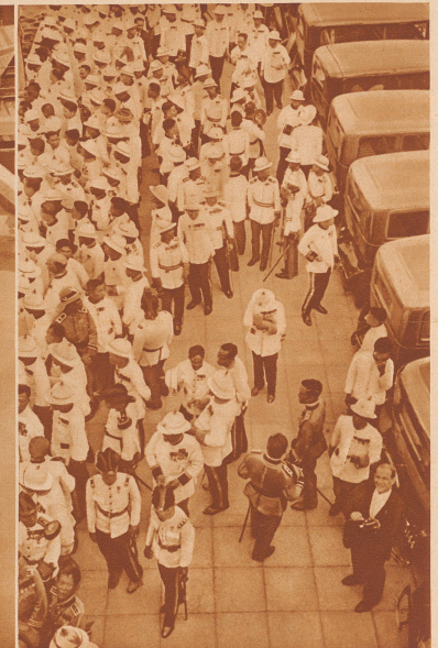
Offiziere und Hofbeamte, in modernsten englischen Luxusautomobilen hergefahren, warten am Fluß, um das Defilé der alten Barken anzusehen