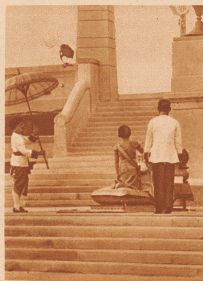
Die Königin von Siam spricht ein Gebet vor dem neuerrichteten Denkmal für Phra Buddha Yowd Fa Tschulok, den Begründer der Tschakri-Dynastie