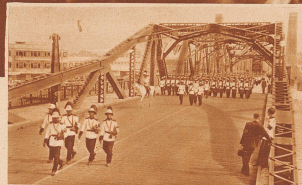
Siamische Infanterie an der Spitze des Festzuges auf der neuen Menambücke. Den Höhepunkt des Festes bildete die Einweihung dieser neuen Brücke über den Menam. Die Klapprücke, ein Prunkstück moderner Technik, kostete 260 000 englische Pfund