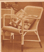
ROHRMÖBEL In der Form und im Preis mit der Zeit, in der Qualität unverändert. Rohrindustrie Rheinfelden Katalog L 2