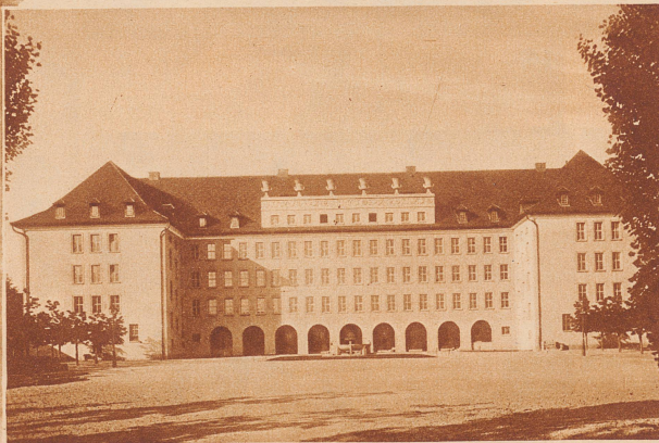
Das 1923 erbaute Sekundarschulhaus von Oerlikon und Schwamendingen. Die finanziellen Opfer des Staates und der Gemeinden für die schulpflichtige Jugend spiegeln sich in den mächtigen Schulpalästen, die überall im Kanton gebaut wurden.