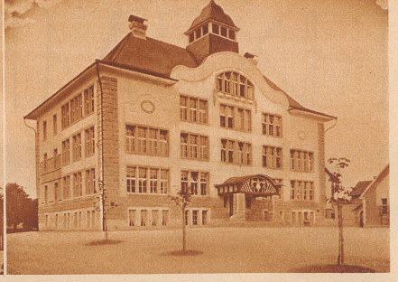
800 Primar- und Sekundarschüler müssen in Veltheim zur Schule gehen. 1906 wurde das Sekundarschulhaus eingeweiht, mit dem das alte gemütliche Schulhäuschen kaum noch zu vergleichen ist.