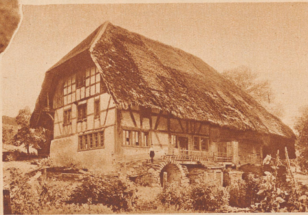
Das frühere Schulhaus von Hüttikon im Furtall war zugleich Schul- und Bauernhaus. Es ist das einzige Strohdachgebäude im Kanton Zürich, das sich dank dem Heimatschutz als Kulturdenkmal erhalten hat.

unterrichtet, so ließ im Jahre 1835 der Erziehungsrat eine Anleitung über die Erbauung von Schulhäusern und Plänen mit Baubeschreibungen herausgeben, an die sich die Schulgemeinden künftig zu halten hatten. Doch dieser uniforme Schulhaustyp zeichnete sich keineswegs durch Schönheit aus. Mit den wachsenden hygienischen und ästhetischen Anforderungen wurden auch die Schulhäuser individueller und repräsentabler gestaltet. Ja, in den letzten Jahrzehnten entstanden wahre Paläste, die man mit Stolz den Fremden zeigt. Aber schon meldet sich die junge Generation, die findet, daß Monumentalität den Kindern wenig sagt, daß kleinere und treppenlose Gebäude mitten im Grünen, mit großen Fenstern und Bauelementen, die dem Fassungsvermögen des Kindes angepaßt sind, das Schulhaus der Zukunft bedeuten.