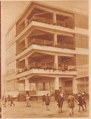
Sind repräsentative Paläste mit formschönen Fassaden das Wahre für unsere Schulkinder? fragt sich die jüngere Generation. Sie wünscht sich auch in der Schweiz ähnliche Bauten, wie diese Freiluftschule von Amsterdam. — Eine Ausstellung des Kunstgewerbemuseums Zürich, die bis zum 14. Mai geöffnet ist, setzt sich mit dem neuen Schulbau auseinander.

Das Mädchen trägt zum erstenmal seinen Schulsack auf dem Rücken. Da drüben steht groß und gewaltig das Schulhaus, das über eine Million gekostet hat. Da hinein muß es, viele Jahre, Tag für Tag.