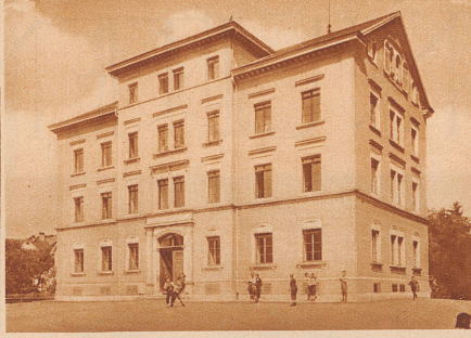
Die Schülerzahl wuchs mit dem Schulzwang. Das Schulgesetz von 1832 forderte geräumige Schulhäuser. Man baute ein neues. Das genügte 50 Jahre. 1878 erstellten die Veltheimer ihr heutiges Primarschulhaus, genau nach den Plänen des kantonalen Erziehungsrates.