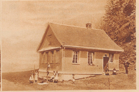
Das höchstgelegene Schulhäuschen des Kantons Zürich auf der Strahllegg ist 1828 erbaut worden. Wie Sternenberg für die Pfarrer, so galt die Strahllegg früher einmal für die Lehrer als Verbandsort.