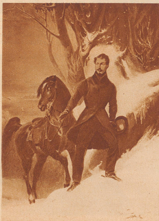
Prinz Louis Napoleon, 24 Jahre alt, gemalt von Felix Cottreau zur Zeit, da ihm im Jahre 1832 das Schweizer Bürgerrecht geschenkt wurde

Durch den Tod des Herzogs von Reichstadt im Jahre 1832 war Louis Napoleon auch das anerkannte Haupt der Napoleoniden geworden. Die Sympathien für den Prinzen in der Schweiz kamen am deutlichsten zum Ausdruck, als er wegen politischer Umtriebe gegen Frankreich aus der Schweiz ausgewiesen werden sollte. Da berief sich der Großteil der schweizerischen Politiker auf die thurgauische Bürgerrechtsakte und verweigerte strikte die Ausweisung. In den Räten gab es darob schwer erhitzte Köpfe, aber schließlich entschloß sich der Prinz, die Schweiz freiwillig zu verlassen, was nicht ohne große Sympathiekundgebungen von seiten des Volkes geschah. Die Schweiz aber wurde durch die Abreise vor einem unliebsamen Konflikt mit Frankreich bewahrt. Hgt.