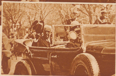
Der Präsident der spanischen Republik Alcalá Zamora (im Auto) bei der Abnahme einer großen militärischen Parade am 14. April