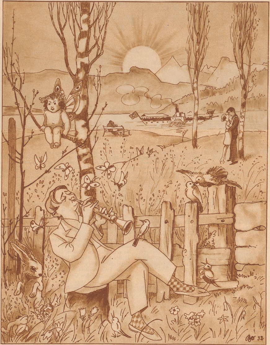
«Holder Frühling du nahst ...»

Der Professor antwortete zerstreut: «So schreibe einstweilen mit Bleistift!»