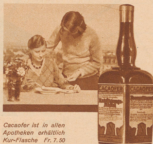
Cacaofer ist in allen Apotheken erhältlich Kur-Flasche Fr. 7.50

Der Affe aber war wieder ein zerstreuter Affe geworden, suchte bereits aufmerksam seinen Ellbogen ab und machte sich jetzt mit einem Sprung auf die alte Tour — über Leiter, Stange, Treppe und Trapez, wobei er den Schweiß eines baumelnden Bruders kunstvoll als Seilstrippe mitbenutzte.