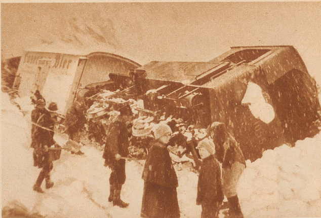
Ein Lawinenunglück auf der Brünig-Bahn. Während der letzten großen Schneestürme ging zwischen Kaiserstuhl und Lungern eine Lawine nieder und warf einen vorüberfahrenden Zug um, wobei glücklicherweise niemand verletzt wurde