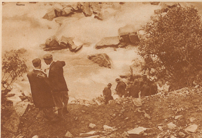
Prozeß Halsmann. Lokaltermin an der Absturzstelle. Der Herr rechts mit der Trauerbinde um den Arm ist der Angeklagte Halsmann

auf übergroßer Einbildungskraft, die zum Schluß an ihre eigenen Erfindungen glaubt. Auch die Revision des Prozesses brachte, entgegen dem Wunsch der gesamten Öffentlichkeit, keinen Freispruch, sondern Bestätigung des Urteils. Auch hier wieder ein Fall, wo der Indizienbeweis und der Beweis durch Zeigenaussagen vollkommen versagte. Die wirkliche Wahrheit war nicht zu ergründen, nur zu erfüllen. Wo aber blieb der Satz: «In dubio pro reo» (Im Zweifelsfall für den Angeklagten)?