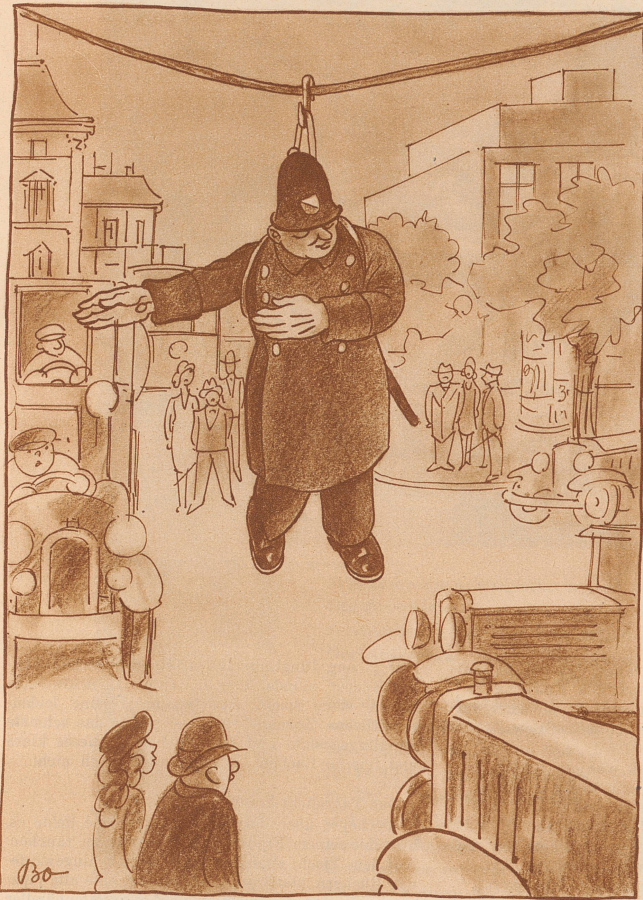
Zeitungsnotiz: ... an dieser Straßenkreuzung wird versuchsweise statt dem Verkehrspolizisten eine Verkehrslampe aufgehängt. Wenn sich die Verkehrslampe nicht bewährt? Wird man dann den Verkehrspolizisten wieder aufhängen?