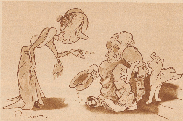
«Können Sie denn im Laufe des Tages so viel zusammenbetteln, daß Sie davon leben können?» «Nein... nicht immer, liebe Frau - manchmal muß ich selber etwas dazulegen»