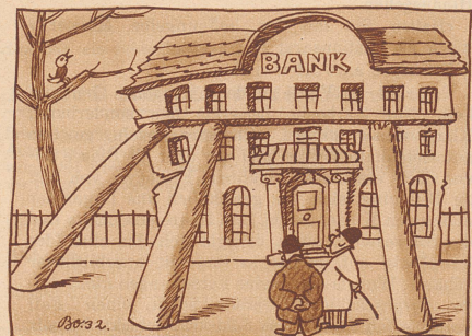
Wie sich der Seppe-Toni die «Stützungsaktion» einer Bank vorstellt

Zeuge: Ich — ich — Herr Richter, ich bin die ganze Nacht zu Hause gewesen und habe ununterbrochen auf die Uhr und den Kalender geschaut.