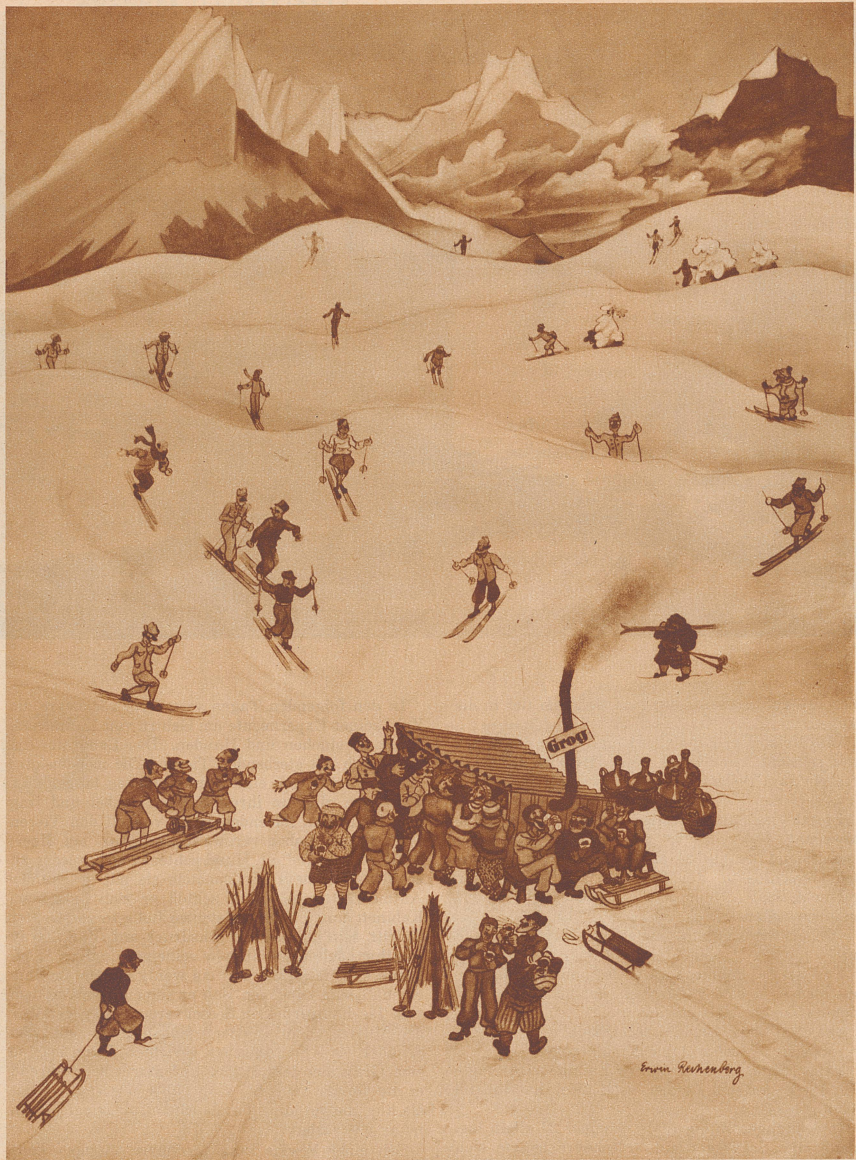
«Oase» Zeichnung von E. Rechenberg