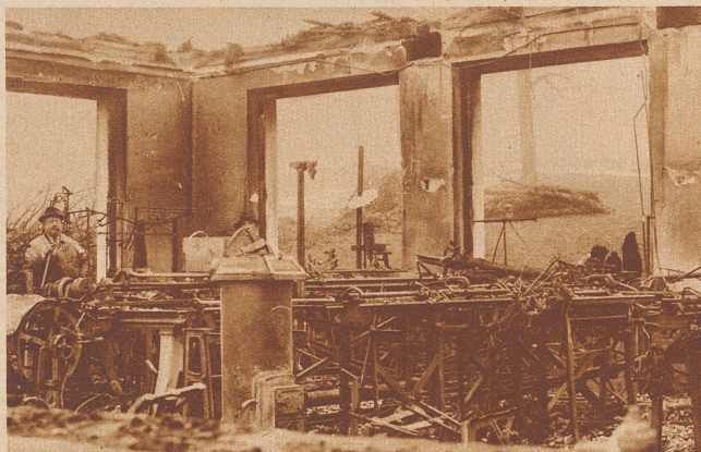
Großer Fabrikbrand im Kanton Schwyz. In der Morgenfrühe des 16. Januar ist das Fabrikgebäude der Strickwarenfabrik Tuconia A.-G., in Tuggen, offenbar infolge Kurzschluß, vollständig niedergebrannt. Der Schaden beläuft sich auf über 150 000 Franken. Mit dem Wiederaufbau der Fabrik soll unverzüglich begonnen werden. Unser Bild zeigt den Haupt-Fabrikationsraum nach dem Brand. Sämtliche Strickmaschinen fielen den Flammen zum Opfer