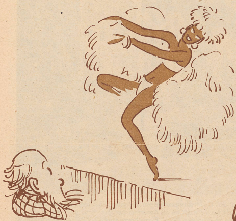
Wo sie cho ischt, hät er de Huet sofort abgnoh!