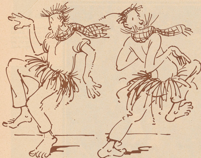
... das hät sich erscht e so rächt zeigtet wo n'er wieder diheim gsi ischt... i der Schüür usse!