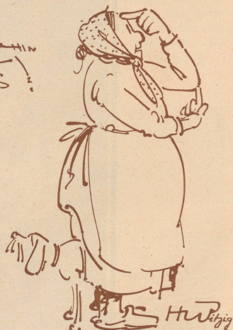
De Piffi hät glueget! Und d'Kathrii hät sich uf em Absatz umedreht

Die «Zürcher Illustrierte» erscheint Freitags • Schweizer Abonnementspreise: Vierteljährlich Fr. 3.40, halbjährlich Fr. 6.40, jährlich Fr. 12.—. Bei der Post 30 Cts. mehr. Postcheck-Konto für Abonnements: Zürich VIII 3790 • Auslands-Abonnementspreise: Beim Versand als Drucksache: Vierteljährlich Fr. 4.50 bzw. Fr. 5.25, halbjährlich Fr. 8.65 bzw. Fr. 10.20, jährlich Fr. 16.70 bzw. Fr. 19.00. In den Ländern des Weltpostvereins bei Bestellung am Postschalter etwas billiger. Insertionspreise: Die einspaltige Millimeterzeile Fr. —.60, fürs Ausland Fr. —.75; bei Platzvorschrift Fr. —.75, fürs Ausland Fr. 1.—. Schluß der Inseraten-Annahme: 14 Tage vor Erscheinen. Postcheck-Konto für Inserate: Zürich VIII 15769. Redaktion: Arnold Käbler, Chef-Redaktor. Der Nachdruck von Bildern und Texten ist nur mit ausdrücklicher Genehmigung der Redaktion gestattet. Druck, Verlags-Expedition und Inseraten-Annahme: Conzett & Huber, Graphische Etablissements, Zürich, Morgartenstraße 29 • Telegramme: ConzettHuber. • Telefon: 51.790