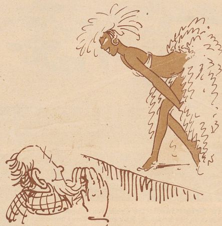
Ganz hii ischt er gsi...