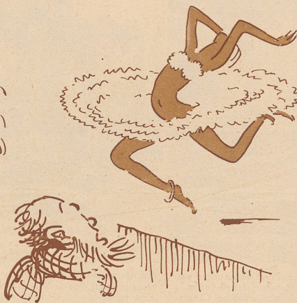
Und hät glueget!