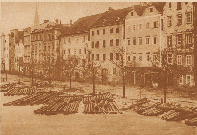
In Oesterreich wurde von den Ueberschwemmungen besonders die unglückliche oberösterreichische Stadt Steyr betroffen, die bis vor kurzem als Autostadt berühmt war, jetzt aber durch die Krise vollständig bankrott geworden ist. Von den 22 000 Einwohnern sind 12 000 dauernd erwerbslos. Die Enns, ein Nebenfluß der Donau, schwoll heftig an und richtete in der ruinierten Stadt großen Schaden an. Loggeschwemmte Flöße aus dem Gebirge trieben auf den Fluten durch die Straßen der Stadt