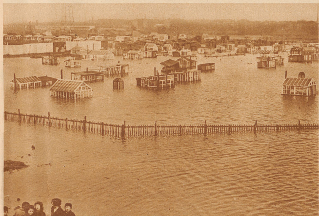
In Schottland: Das Gebiet von Glasgow ist durch ungeheure Ueberschwemmungen verwüstet. In den Straßen der Stadt steht das Wasser bis zu 4 m hoch. 2000 Menschen sind obdachlos. – Unsere Aufnahme zeigt den vollkommen überschwemmten Industriebezirk Dalmarnock bei Glasgow